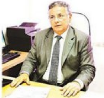
► Israel Ferreira, novo procurador-geral

ASSEMBLEIA SUBSTITUI ENVOLVIDOS EM OPERAÇÃO