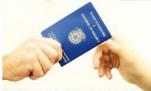
► O estudo do IBGE aponta que o índice potiguar ficou praticamente estável, passando de 11,5% para 11,6%

No segundo trimestre de 2014 (abril, maio e junho) e nos primeiros meses deste ano (janeiro, fevereiro e março) o índice de desocupação - que inclui empregos formais, informais, autônomos e empreendedores - no Rio Grande do Norte era de 11,5 (175 mil). Este era o maior índice registrado no país. Entre abril, maio e junho deste ano, a situação na Bahia e Alagoas passou com taxa de 12,7