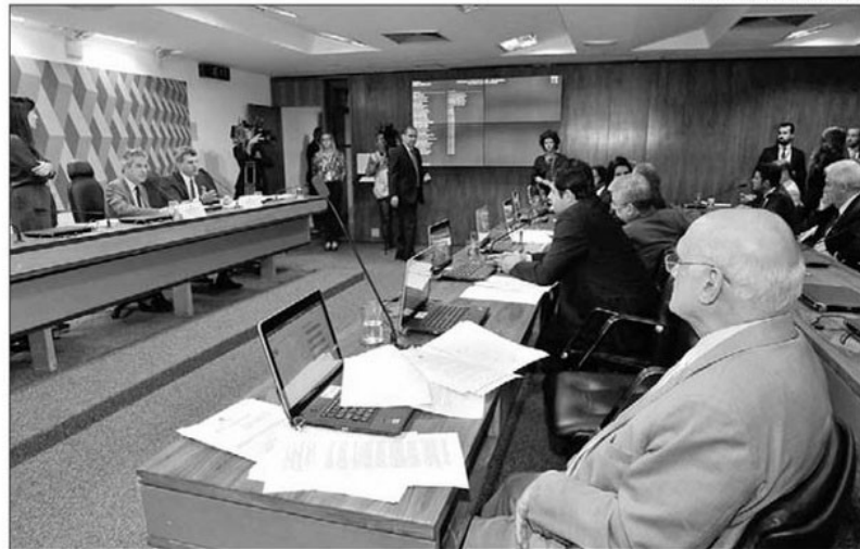
Parlamentares debatem e votam os projetos de reforma política na Comissão Especial do Senado

O projeto de reforma política traz outras barreiras às doações. As que vierem de empresas só poderão ser destinadas aos partidos. Além disso, uma