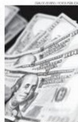
Dólar tem alta de 33,7% em 2015

Nas últimas semanas, o mercado financeiro global tem enfrentado turbulências provocadas pela queda das ações de empresas chinesas. Desde o início de junho, a Bolsa de Xangai perdeu 42,6% do valor. Nos últimos dias, a queda intensificou-se, provocando instabilidade nos mercados globais. Há duas semanas, o Banco Central da China desvalorizou o yuan (moeda do país) para tornar as exportações mais competitivas.