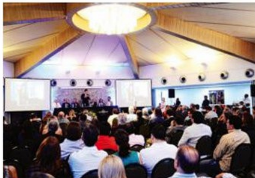
Além do investimento de R$ 100 milhões também há previsão a chegada de quatro novos voos ao RN

club), grande área para animação, 3 piscinas exteriores, 1 deck com escuridão para crianças", explicou.