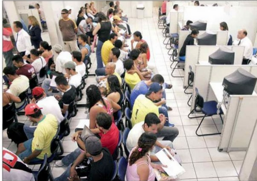
Atendimento no Sine, que encaminha trabalhadores para empresas: Geração de vagas é insuficiente