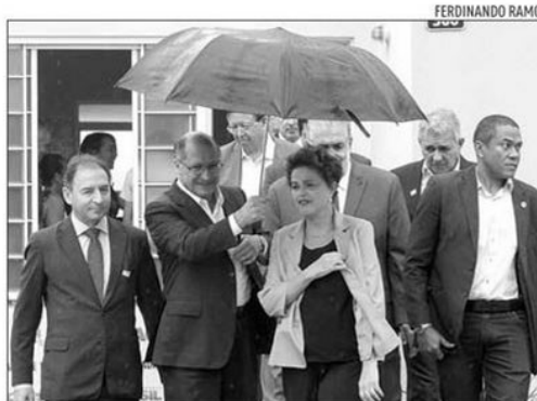
Dilma Rousseff reconhece que o "momento é de dificuldades"

Na rápida entrevista, concedida por telefone do Palácio do Alvorada, antes de seguir viagem para cumprir agenda em quatro cidades, a presidente da República frisou que a economia