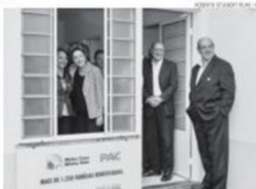
Dilma Rousseff entrega casas em São Paulo, com Geraldo Alckmin

com estados e municípios vai continuar e não depende da relação dos partidos das gestões com o governo federal. São Paulo é administrado há mais de 30 anos pelo PSDB. "Tenho certeza de que essa parceria com estados e prefeituras vai continuar e está baseada em uma visão democrática e republicana da crise pública. Podemos divergir, mas temos que agir juntos no que se refere à administração para proteger os interesses da