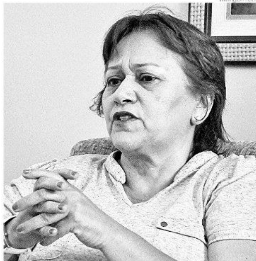
Fátima Bezerra é prioridade do PT para ser candidata ao Senado da República