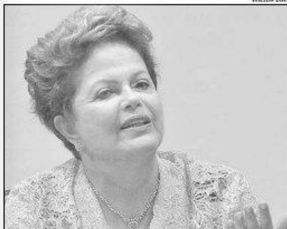
Este é o maior ciclo de alta de juros do governo Dilma Rousseff