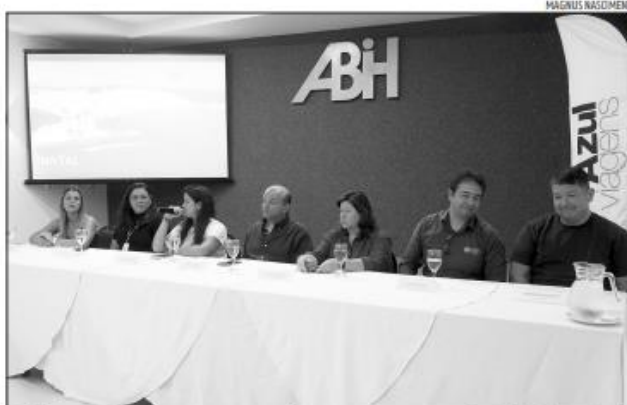
Azul Viagens anunciou as novas rotas e mais assentos em evento na sede da ABIH-RN, em Natal

Além do crescimento para a alta de julho, a empresa incluiu mais de 82.866 mil assentos em Natal para o primeiro semestre de 2024 (de fevereiro a junho), representando um crescimento de 68% comparado com o mesmo período do ano passado. "Fortalecemos resul-