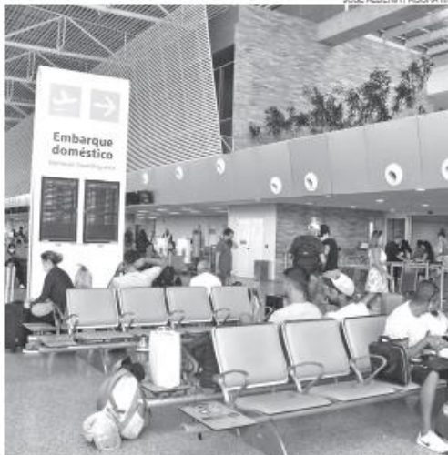
Azul Viagens disse que a alta temporada de julho deste ano terá alta de 17%