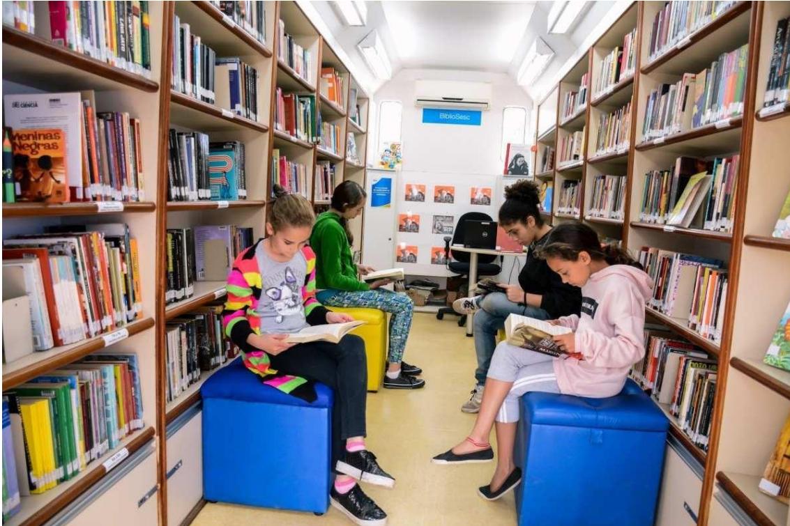
Além das bibliotecas, leitores contam com unidades móveis do BiblioSesc

A Rede de Bibliotecas do Sesc alcançou em 2023 a marca de 1,3 milhão de livros emprestados, o que representa em média 4 mil publicações cedidas por dia a milhares de leitores em todo o país.