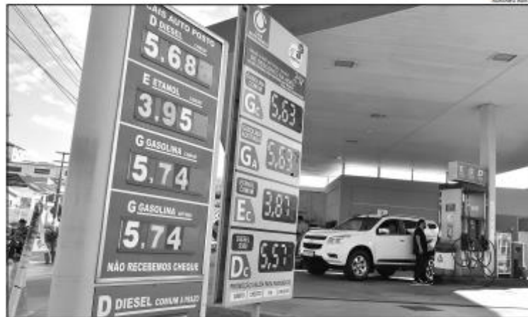
Consumidor vai encontrar a gasolina mais cara a partir de hoje. Ontem, muitos motoristas abasteceram os carros para fugir do aumento

Na semana passada, na quinta-feira (25), a empresa elevou o valor do litro para R$ 3,15. Enquanto isso, o preço nas bombas tem apresentado redução nas últimas semanas, conforme levantamento da Agência Nacional do Petróleo, Gás Natural e Biocombustíveis (ANP). Segundo a pesquisa, na semana de 31 de dezembro de 2023 a 6 de janeiro deste ano, o preço médio do litro da gasolina era de R$ 5,92. Na semana de 14 a 20 de janeiro, a média estava em R$ 5,79 e em R$ 5,74 no mais recente levantamento (realizado entre 21 e 27 de janeiro).