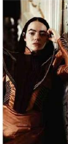
Stone, indicada ao Oscar, como Bella Baxter