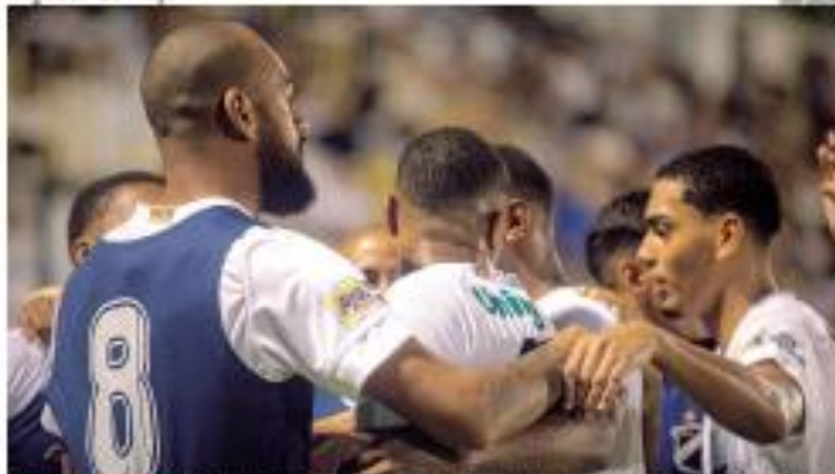
• COMPARTILHO ESTADOS Em um jogo de futebol, o jogador 10 abraça o jogador 11, em comemoração ao gol marcado no jogo. O gol, que deu a vitória ao Atlético no estádio Petropolis, no bairro de Litoral. Uma vitória importante, domingo, pela Copa do RN. • PÁGINA 2 •