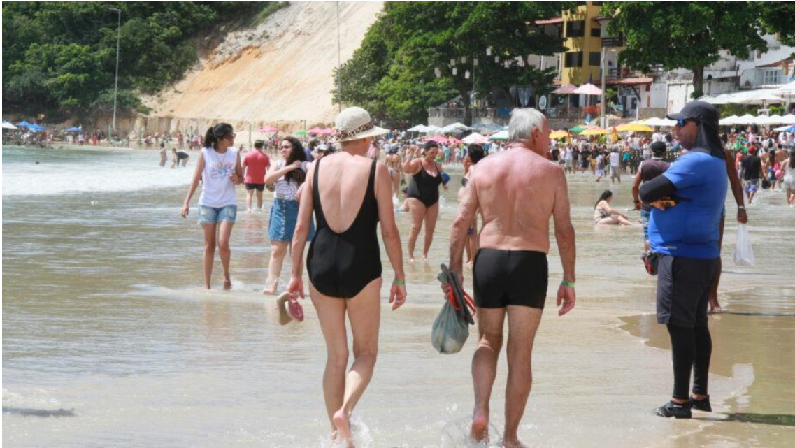
Turistas aproveitam dia de sol na Praia de Ponta Negra; procura pelo destino tem aumentado, apontam rankings

Apesar de ser a segunda capital brasileira com a menor área territorial, Natal é um dos destinos mais visitados por turistas nacionais ou estrangeiros no Brasil. Além de diversos atrativos como belezas naturais, a Cidade do Sol possui muita história, arquitetura e uma excelente gastronomia, com pratos típicos saborosos.