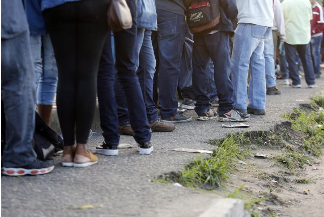
Fila para inscrição em vaga de emprego

O desemprego de longa duração caiu no quarto trimestre e a taxa de desocupação recuou tanto para homens quanto para mulheres. A distância entre eles e elas no mercado de trabalho, porém, aumentou devido ao ritmo maior de queda do desemprego entre os homens. É o que apontam os dados da Pesquisa Nacional por Amostra de Domicílios Contínua (PNAD Contínua), divulgada nesta sexta-feira pelo IBGE .