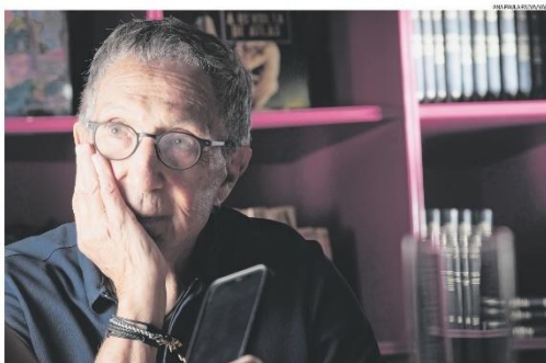
Abilio Diniz: empresário foi peça crucial na construção do GPA, tornando a varjeista dona do Plo de Açúcar uma potência

Um dos símbolos do capitalismo e empreendedorismo nacional, Abilio Diniz morreu ontem, aos 87 anos, de insuficiência respiratória em função de uma pneumonia. O empresário estava internado desde janeiro no Albert Einstein, em São Paulo, para onde foi transferido após passar mal nos EUA, durante uma período de férias em Aspen, no Colorado. Peça crucial na construção do GPA, Abilio tornou a varjeista dona do Plo de Açúcar uma potência, especialmente entre os anos 80 e início os anos 2000, até deixar a companhia, de forma definitiva em 2015, quando vendeu o resto de suas ações. Era membro do conselho de administração do Carrefour. A informação foi confirmada pela família ontem no fim da noite. Acompanhe a cobertura no site do Valor: valor.com.br