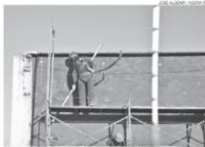
Taxa de desocupação do país no último trimestre de 2023 foi de 7,4%.

Rio Grande do Norte tem segunda menor taxa de desocupação da região Nordeste, aponta relatório divulgado pelo Instituto Brasileiro de Geografia e Estatística