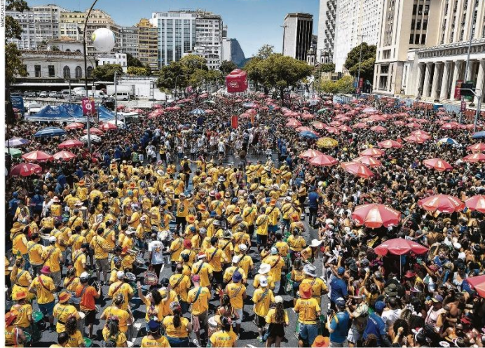
Megadespedida. Milhares de foliões do Monobloco desfilam no circuito da Rua Primeiro de Março, no Centro, no último dia do calendário oficial de blocos do Rio de Janeiro