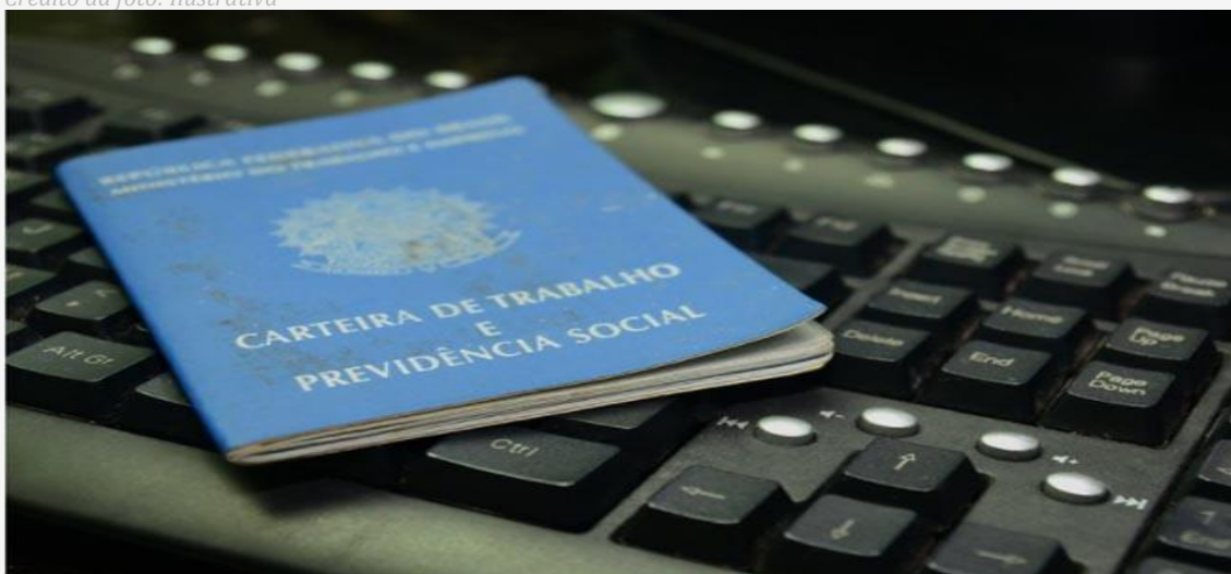
Taxa de desocupação recua no RN

O Rio Grande do Norte foi estado da federação que apresentou a maior queda do desemprego no último trimestre de 2023. A taxa recuou de 10,1% para 8,3%, segundo a Pesquisa Nacional por Amostra de Domicílios (PNAD) Contínua Trimestral, divulgada nesta sexta-feira (16) pelo Instituto Brasileiro de Geografia e Estatística (IBGE).