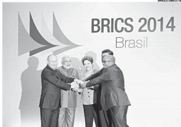
Chefes de estado também acordaram a criação de um fundo emergencial para os BRICS

Dessa forma, fica oficializada a criação do banco de desenvolvimento dos Brics, o principal acordo firmado nesta sexta cúpula do bloco, que acontece até esta terça em Fortaleza, e a partir de amanhã em Brasília. A ideia do banco surgiu como um complemento à atuação das ins-