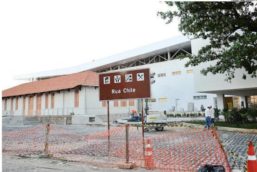
Terminal de passageiros prometido para antes da Copa deverá ser concluído dia 21, mas ainda não tem data de inauguração oficial