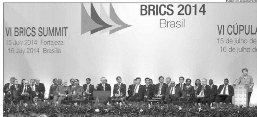
De acordo com Dilma, novo banco é alternativa para necessidades de financiamento à infraestrutura de países em desenvolvimento

A criação oficial do banco foi o principal acordo firmado na sexta cúpula do Brics, que aconteceu até ontem em Fortaleza e a partir de hoje continua em Brasília. A ideia do banco surgiu como um complemento à atuação de instituições internacionais, como FMI e Banco Mundial.