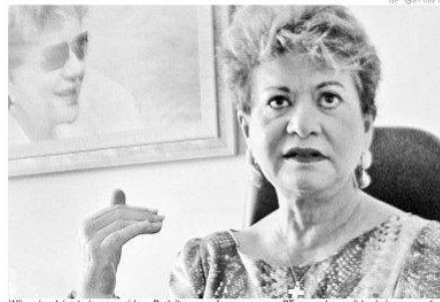
Wilma também teria assumido a Prefeitura, conforme acusa o PT em outro pedido de impugnação

Parte das ações propostas pelo procurador regional Eleitoral, Gil-