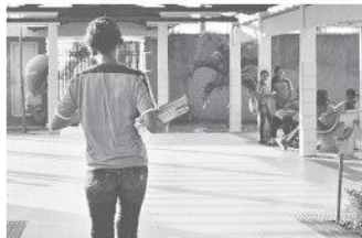
► Escolas municipais: reposição de aulas em até dois sábados por mês

A rede municipal tem 4.748 professores, sendo 3.644 do ensino fundamental, 644 educação infantil e 460 temporários. De toda a rede, duas escolas tiveram paralisação total; 45 unidades sofreram paralisação parcial, com suspensão de aulas de artes, ensino religioso e educação física; 25 escolas não tiveram greve. Dos 48 CMEIs, cinco paralisaram as atividades totalmente e 19, parcialmente.