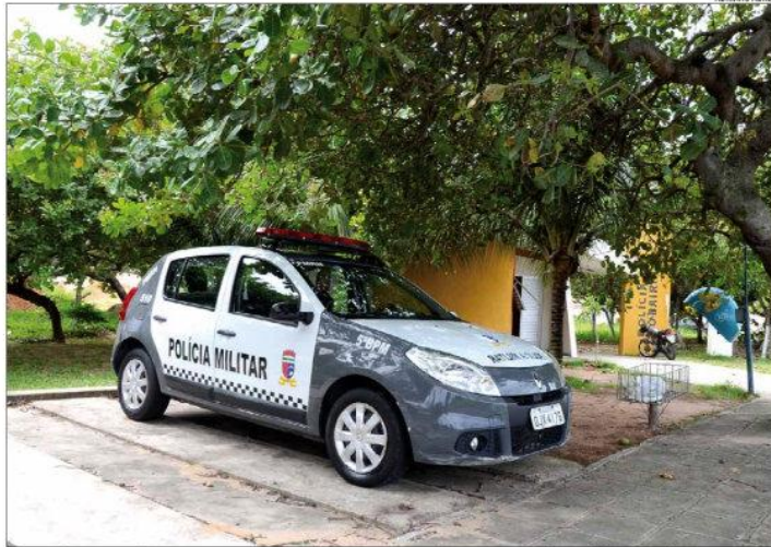
PM possui apenas dez viaturas para patrulhar sete bairros da zona Sul da cidade e essa quantidade diminui para seis durante a noite