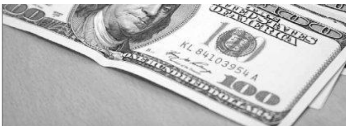
O dólar subiu diante das principais moedas, à exceção da libra, após declaração de Janet Yellen

Levantamento da empresa Cielo mostra que Natal concentrou 2,7% do total gasto por turistas estrangeiros, durante a Copa, superando Curitiba (2,4%), Manaus (2,3%) e Cuiabá (1,2%). « PÁGINA 6 »