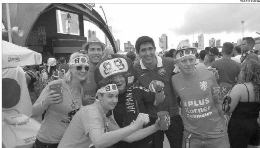
Turistas durante a Copa em Natal: a cidade recebeu quatro jogos na Arena das Dunas e viu crescer a movimentação financeira

« COPA DO MUNDO » A participação da cidade nos gastos dos turistas no Brasil foi de 2,7%, durante a Copa, ante 1,4% no mesmo período de 2013