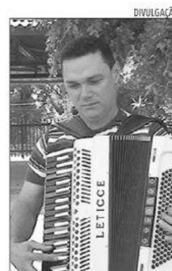
Amazan, entra na relação como candidato a estadual

Nenhum dos candidatos ao pleito de outubro, cujos registros foram objeto de propostas de impugnação apresentadas pela Procuradoria Regional Eleitoral foi notificado pelo TRE. Mesmo assim, tomando conhecimento através dos meios de comunicação, os que foram contactados pela TRIBUNA DO NORTE, pessoalmente ou através de suas assessorias, externaram confiança em sua argumentação de defesa.