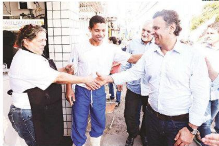
► Página valoriza relacionamento de Aécio com filhos e a esposa com quem casou no início da caminhada eleitoral

No fim do ano passado, o tucano iniciou uma série de processos na Justiça para identificar detratadores que vinculavam, na rede, seu nome ao abuso de álcool e