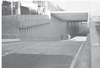
► Túnel da Avenida Capitão Mor-Gouveia sob a Avenida Prudente de Moraes