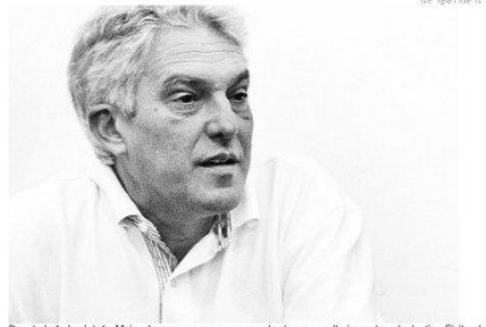
Deputado federal João Maia não comprovou o pagamento de uma multa imposta pela Justiça Eleitoral

Segundo a legislação eleitoral, o condenado ao pagamento de multa deve comprovar a quitação ou o parcelamento da dívida até a data da formalização do pedido de registro de candidatura. Caso os dois tenham efetuado o pagamento e o sistema do TRE não tenha atualizado a informação, ambos ainda poderão demonstrar a regularidade. O mesmo acontece em re-