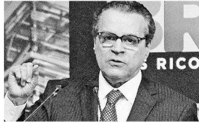
Henrique Alves tem maior preferência dos eleitores, com 38,24% das citações