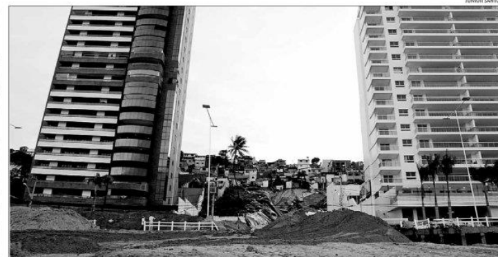
Além do "Infinity" e "Aldebaran", atingidos diretamente pelo deslizamento, outras 13 edificações de Areia Preta devem ser vistoriadas