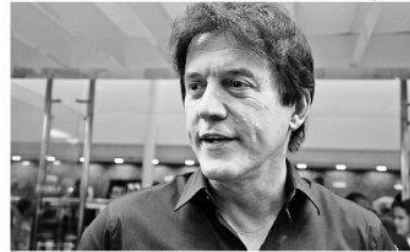
Robinson Faria é segundo colocado, com 22,88%, segundo a pesquisa da Consult

Wilma de Faria, venceria a eleição, com 40,35% das intenções de voto. A pré-candidata do PT,