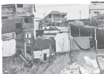
Em Mãe Luiza, entre 20 e 40 casas desmoronaram ou foram atingidas