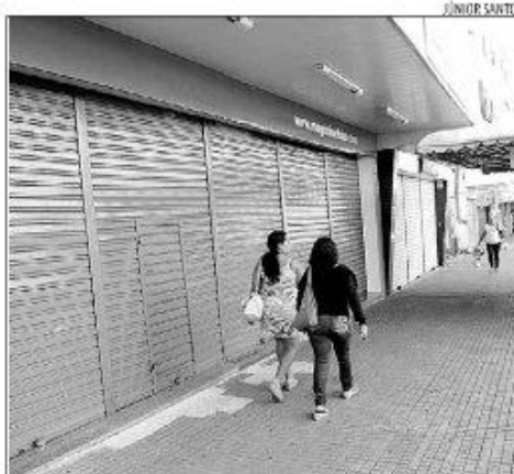
Lojas fecharam as portas uma hora antes da partida do Brasil

Na avenida Rio Branco, dezenas de pessoas ainda esperavam na parada de ônibus, mas nenhum passou durante os minutos em que a reportagem esteve no local. Na avenida Prudente de Moraes, a cena era semelhante. Não havia ônibus na avenida, para preocupação das pessoas que queriam chegar em casa ou encontrar amigos para celebrar o futebol.