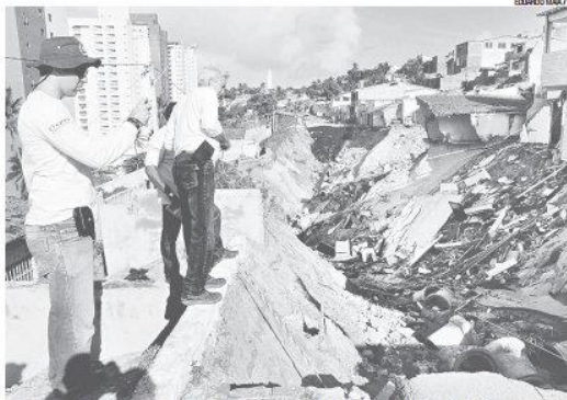
Geólogos especialistas em desastres naturais analisam soluções para o deslizamento de terra em Mãe Luiza

Por indicação da equipe de geólogos da UFRN, que ocorreu no local logo depois do desastre, foi feita uma escavação na terra acumada pelo deslizamento que inter-