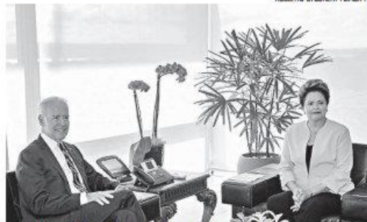
ROBERTO STUCKERT FILHO/PR

O vice-presidente dos Estados Unidos destacou o apoio dado pelo governo norte-americano ao Iraque, que passa por uma crise diante das ações do grupo Estado Islâmico do Iraque e do Levante (EIL). Biden afirmou que o governo tem mantido consultas com líderes do Iraque, "ao mesmo tempo em que