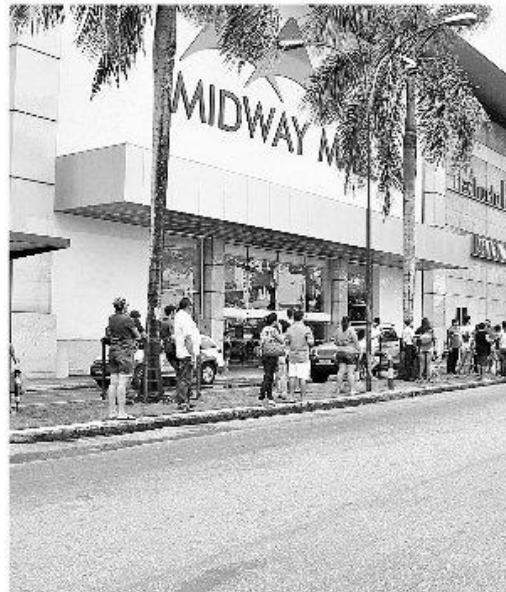
Consumidores têm enfrentado dificuldades para chegar aos shoppings

Segundo as entidades, o comércio natalense tem arcado com imensos prejuízos em virtude da falta de ônibus. "Estamos em um momento em que deveríamos estar faturando alto. Nos preparamos para a Copa e agora temos que arcar com estes prejuízos. A forma como a greve vem sendo conduzida, está nos impingindo", disse o diretor