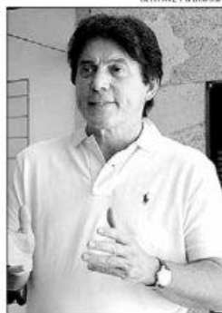
Robinson: nota conjunta