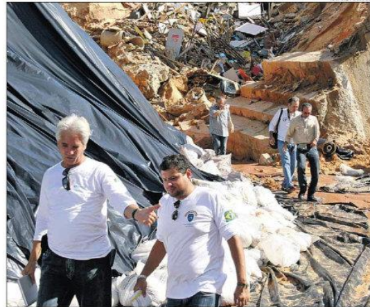
Geólogos do Governo Federal fizeram ontem a primeira visita à cratera aberta na Guanabara

PÁGINAS 2 A 4 Vistoria de prédios e volta dos serviços essenciais