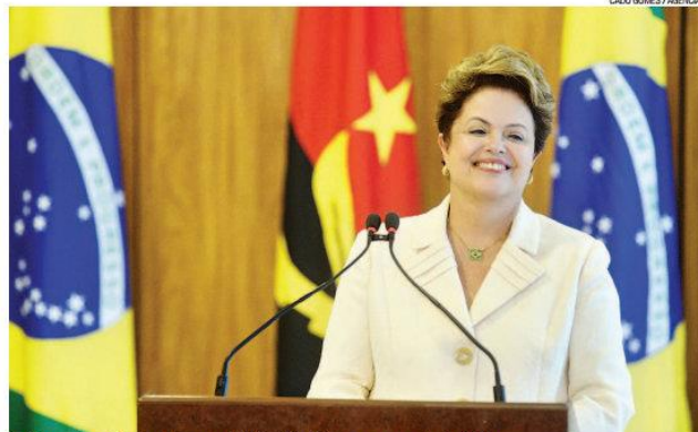
► Dilma vai formalizar mudanças regulatórias, tributárias e na concessão de crédito

A divulgação das medidas será um "retorno" da presidente para as demandas que recebeu dos empresários em encontro