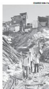
Levantamento dos geólogos irá subsidiar as ações da Prefeitura