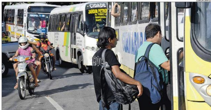
Rodoviários estão em greve desde o dia 12: Sintro e Seturn discutem reajuste salarial de 16%, entre outras questões trabalhistas