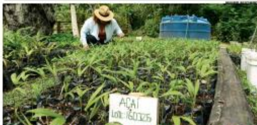
SUSTENTABILIDADE Em Nova Friburgo (RN), a Plantas Inova ao lado a agricultura familiar com a indústria de biotecnologia. Com apoio do BNB, produz dióxido de carbono de forma sustentável. » PÁGINA 19

KEY LUPES O Brasil não pode cruzar os braços: "Quem sabe faz a hora; não espera acontecer". » PÁGINA 16