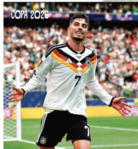
Na camisa. Autor de dois gols, o atacante Kai Havertz veste o número 7, que se tornou cabalístico para a Alemanha

ma nuclear do país persa. O acordo foi anunciado pelo Paquistão e logo confirmado por Trump, que anunciou o fim dos bloqueios navais dos EUA na região e celebrou: "navios do mundo, liguem seus motores. Deixem o petróleo fluir". O governo iraniano destacou que o acordo inclui encerrar os ataques ao Líbano. Horas antes, Israel havia feito nova ofensiva ao sul de Beirute. PÁGINA 20