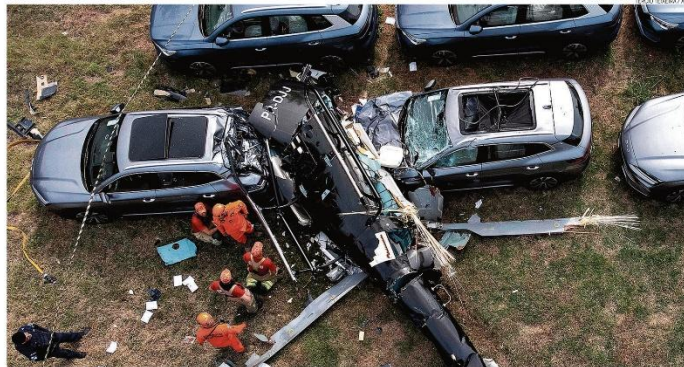
Acidente. Equipes de resgate observam o que restou de um dos helicópteros que caíram no estacionamento de uma concessionária, ao lado da Av. das Américas, no Recreio

RIO DE JANEIRO, SEGUNDA-FEIRA, 15 DE JUNHO DE 2025 ANO CI - Nº 33.915 - PREÇO DESTE EXEMPLAR (R$) - R$ 7,00