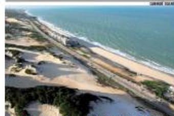
EXCLUSIVO Imagens aéreas revelam constrastes e fragilidades da região da Vila Costeira. Enquanto investimentos seguem travados, há sinais de êxodo e ocupações em áreas protegidas. » PÁGINA 7

ELEIÇÕES 2026 Pré-candidatos ao governo do RN divergem sobre saída para crise fiscal