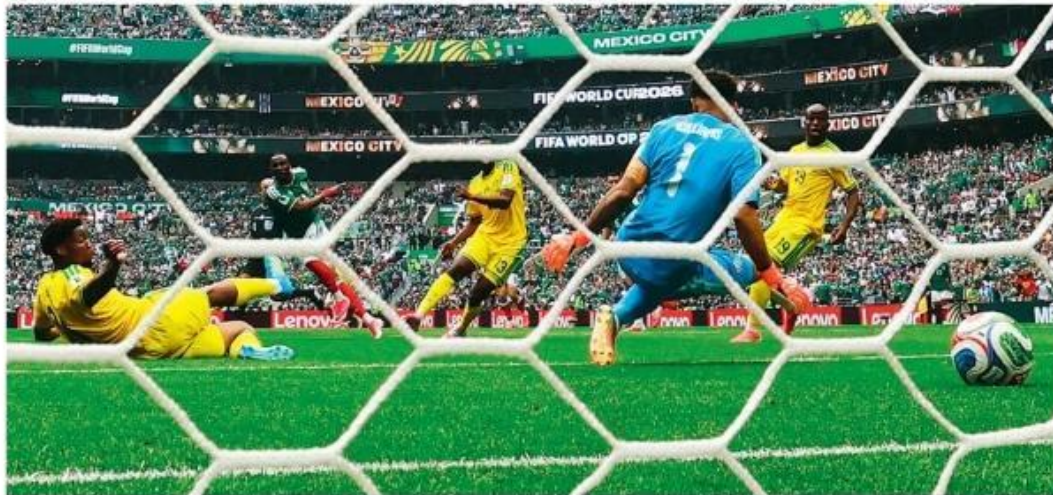
O atacante Julián Quiñones faz o primeiro gol da Copa de 2026, no estádio Azteca, na vitória do México sobre a África do Sul por 2 a 0.