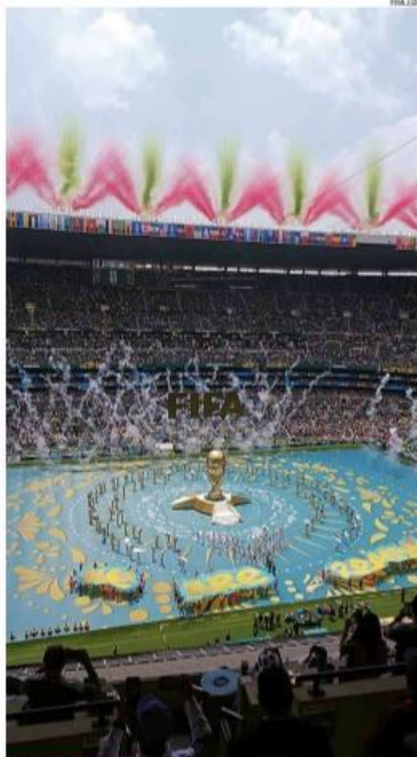
FESTA DE ABERTURA O Estádio Azteca assistiu a um show de abertura com muitas tradições mexicanas, belas imagens e alguns shows musicais, com destaque para a cantora Shakira. « PÁGINA 12 »