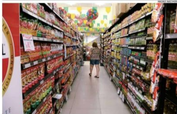
CARESTIA Com a cesta básica 19,03% mais cara em seis meses, atingindo R$ 710,79 em maio, Natal registra a 5ª maior alta do Brasil, puxada por itens como tomate (+138%) e feijão-carioca (34,62%). « PÁGINA 7 »