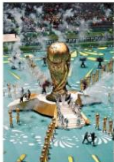
Apelito. Cerimônia de abertura teve impropriedade

NO DE JANEIRO, SEXTA-FEIRA, 12 DE JUNHO DE 2018 ANO 117 Nº 1152 • FRENTE DE EMPLEADO • R$ 2,50