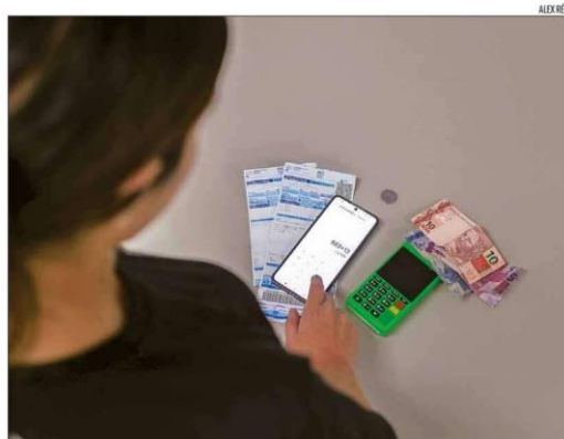
Em Natal, 83,2% das famílias possuem algum tipo de dívida; cartão de crédito é o maior vilão

"A redução da inadimplência deve ser comemorada, mas o elevado percentual de famílias endividadas exige atenção permanente. O grande desafio é transformar o crédito em ferramenta de desenvolvimento e não