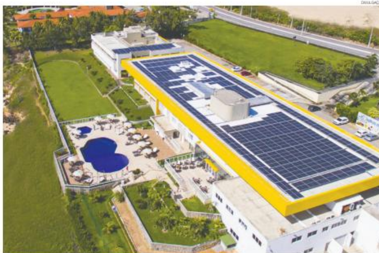
Empreendimento administrado pelo Sistema Fecomércio RN tornou-se referência no setor turístico ao incorporar práticas sustentáveis em sua rotina operacional

Entre os principais reconhecimentos está a certificação internacional ISO 21401, norma específica para sistemas de gestão da sustentabilidade em meios de hospedagem. O Hotel-Escola Senac Barreira Roxa foi pioneiro na América Latina ao conquistar o selo pela primeira vez em 2022 e, desde então, mantém a certificação renovada