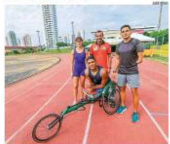
SUPERAÇÃO A 22 edição da Anam Pan News tem reforço o papel das corridas de rua na promoção do bem-estar e da inclusão. Atletas com deficiência relatam ganhos de autonomia e superação por meio do esporte. » PÁGINA 2