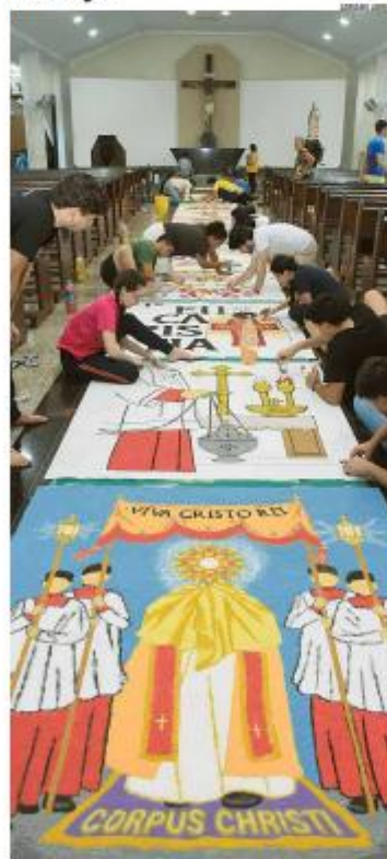
RELIGIÃO Os tapetes ornamentais de Corpus Christi, uma tradição secular na Igreja Católica, mobilizam comunidades e simbolizam a acolhida do "Corpo de Cristo" e de Jesus na Eucaristia. » PÁGINA 9