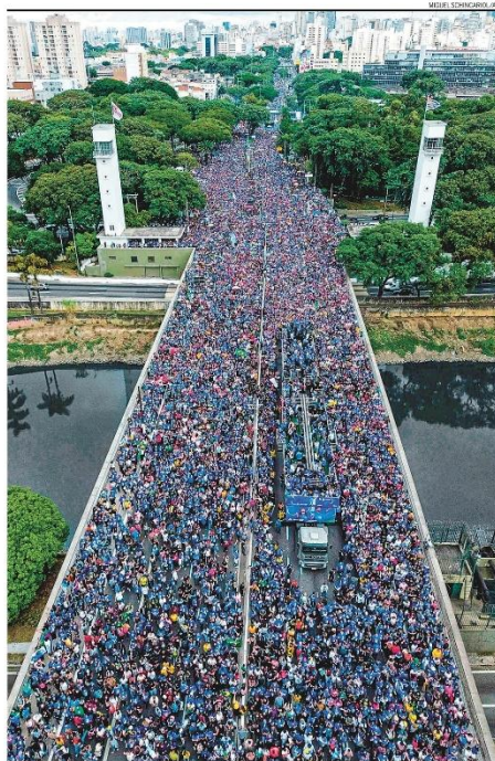
São Paulo. Marcha para Jesus percorreu 3,5 quilômetros entre o Centro e a Zona Norte e reuniu 33,8 mil pessoas

No centro econômico do país, São Paulo assume o desafio de tornar a cidade mais verde. CADERNO ESPECIAL