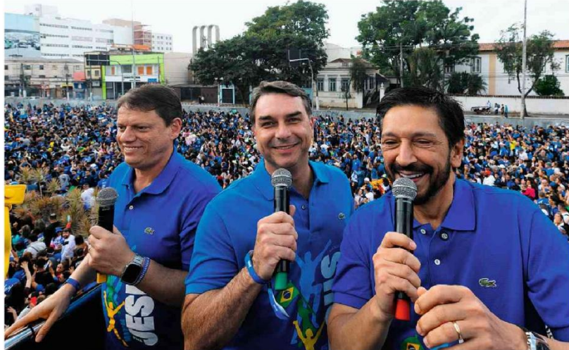
O governador Tarcísio, Flávio Bolsonaro e o prefeito de SP, Nunes, na Marcha para Jesus, na zona norte da capital