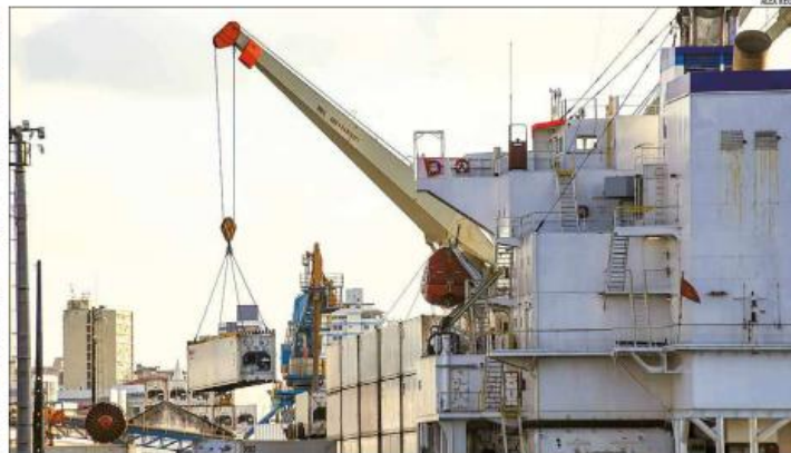
Apesar do resultado negativo em maio, o acumulado de 2026 permanece favorável ao RN, com um superávit de US$ 277,7 milhões

Na sequência, aparecem as frutas e nozes não oleaginosas, frescas ou secas, com US$ 5,8