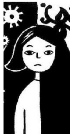
Imagem da obra que narra infância sob jugo da teocracia