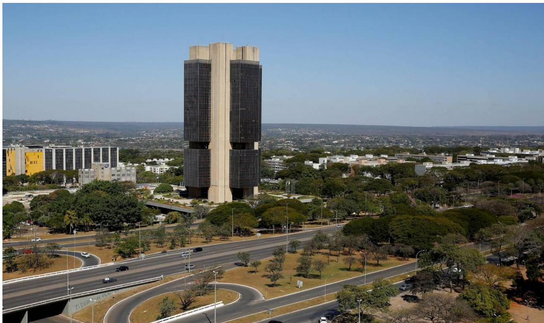
Sede do Banco Central, em Brasília

A mediana do mercado para o IPCA de 2026 subiu de 4,92% para 5,04%, na 11ª alta consecutiva