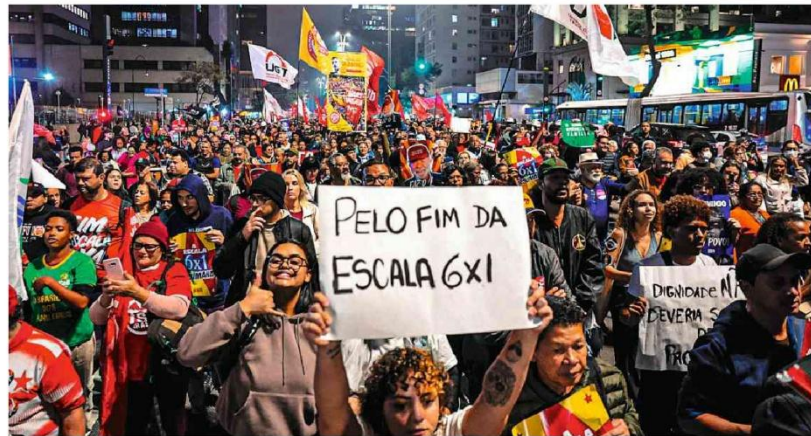
Manifestação na avenida Paulista, em São Paulo, pede o fim da escala 6x1

A Adusp (Associação dos Docentes da USP) aderiu à paralisação dos alunos após impasse na negociação com a reitoria. No entanto, impacto da decisão entre docentes é incerto. A40