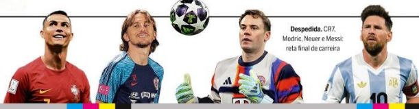
Despedida. CR7, Modric, Neuer e Messi: reta final de carreira

A Alemanha divulgou ontem sua lista com o goleiro Neuer, de 40 anos. Ele se junta a Messi, Cristiano Ronaldo e Modric, astros que também devem disputar seu último Mundial. PÁGINA 30