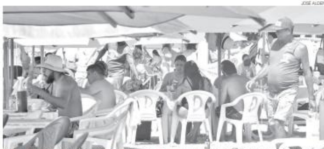
Turistas brasileiros e estrangeiros na praia de Ponta Negra em plena semana neste primeiro trimestre em Natal

Outro ponto destacado pelo instituto é que o avanço ocorreu sobre uma base elevada de comparação. Em março de 2025, o turismo potiguar já havia registrado crescimento de 16,3%, indicando continuidade do aquecimento da atividade eco-