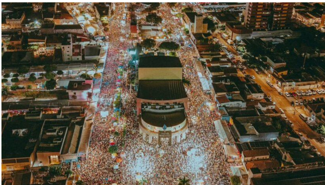
Senac capacita ambulantes em Mossoró