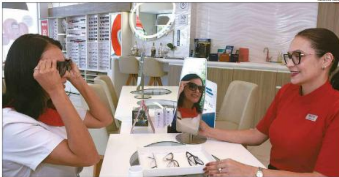
O desempenho da região Nordeste foi impulsionado pelo segmento premium, que ampliou sua presença no mercado local