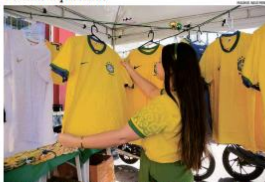
TR NA COPA Lojistas, principalmente do Alcega, relatam aumento na procura por camisetas, bandeiras e acessórios da Seleção Brasileira, mas dizem que as vendas ainda estão abaixo do registrado em 2012. • PÁGINA 7