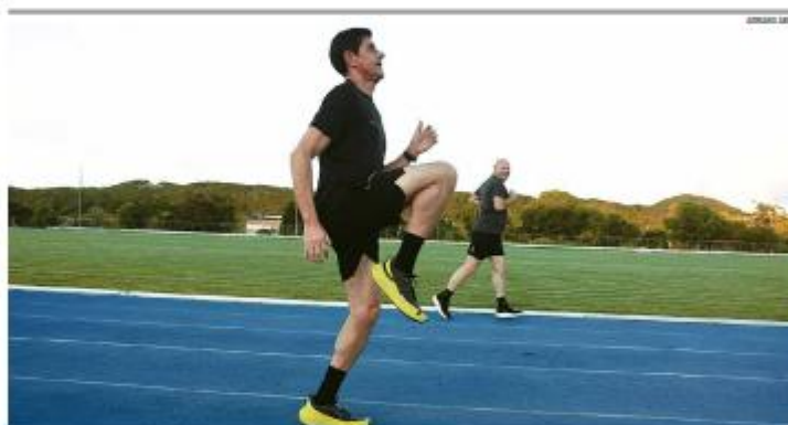
JP NEWS RUN Com a aproximação da corrida Jovem Pan News Natal Run, marcada para 21 de junho, especialistas ouvidos pela TRIBUNA DO NORTE reforçam que a escolha por roupas leves, tecidos tecnológicos e tênis adequados ajuda a melhorar o desempenho no percurso. • PÁGINA 8

A PEC que trata a jornada de trabalho e extingue a escala 6x1 deve ser votada pela comissão especial antes de seguir ao Plenário da Câmara, segundo Hugo Motta. • PÁGINA 4