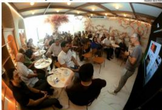
LANÇAMENTO O Sistema Tribuna lançou, nesta terça (12), o novo portal de notícias da Tribuna do Norte. Evento reuniu publicitários e representantes da classe empresarial e do setor público. » PÁGINA 8