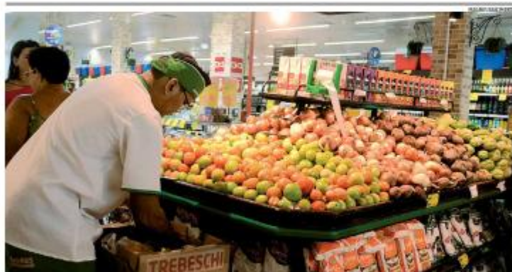
CARRETA O preço do tomate foi o principal vilão da cesta básica em Natal no 12º quadrimestre de 2025. Segundo levantamento da Canab e do Diase, o produto teve alta de 92,66% entre janeiro e abril. No período, a cesta chegou a R$ 609,79 na capital, aumento de 12,70% no ano. » PÁGINA 7

NOVO EDITAL Nova versão do edital da Oferta Permanente de Concessão (OPC), da ANP, contempla 45 novos blocos exploratórios no País, sendo oito terrestres no Rio Grande do Norte, em área da Bacia Potiguar. Com a publicação do certame, os novos blocos já podem receber declarações de interesse, abrindo caminho para o 6º Ciclo da OPC. Setor projeta até R$ 7 bilhões em investimentos no RN e potencial de criação de 20 mil empregos com a exploração de petróleo e gás. No total, a Bacia Potiguar passa a ter 41 blocos disponíveis, incluindo áreas no Ceará. » PÁGINA 1