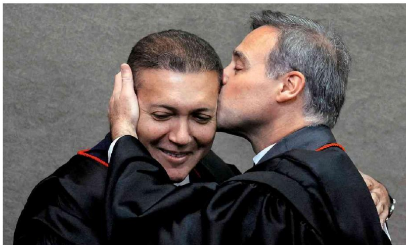
Os ministros Kassio Nunes Marques e André Mendonça, novos presidente e vice do TSE, respectivamente

Com o pacote contra o crime organizado, Lula busca uma marca para área em que, ao lado de seu partido, enfrenta dificuldade histórica. As medidas preveem R$ 10 bilhões para ações no setor, a serem solicitadas por estados e municípios, e R$ 1 bilhão do orçamento federal. Economia A15 e Cotidiano A35