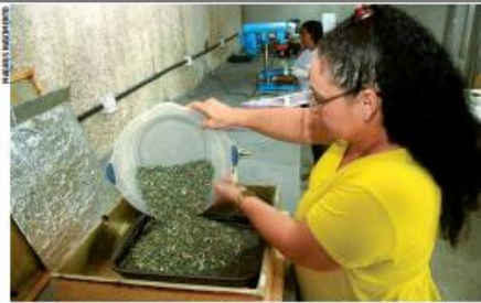
RECYCLAGEM No Gramoni, mulheres transformam resíduos plásticos em móveis sustentáveis por meio do projeto Pró-Catadores, que une inclusão e preservação ambiental. • PÁGINA 10 •