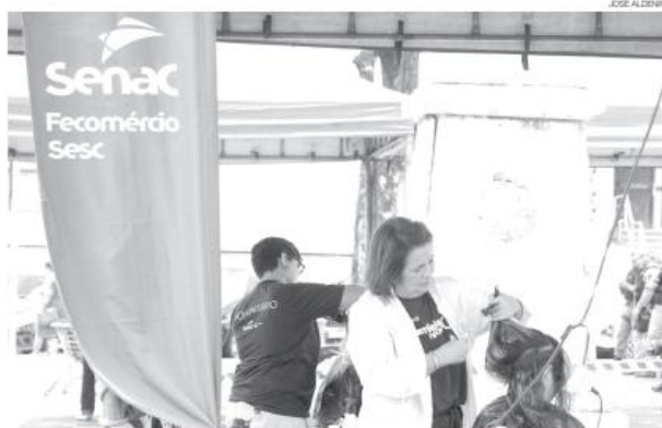
Cursos na área de estética, como de cabeleireiro, barbeiro e manicure também fazem parte da lista da Semana S no RN