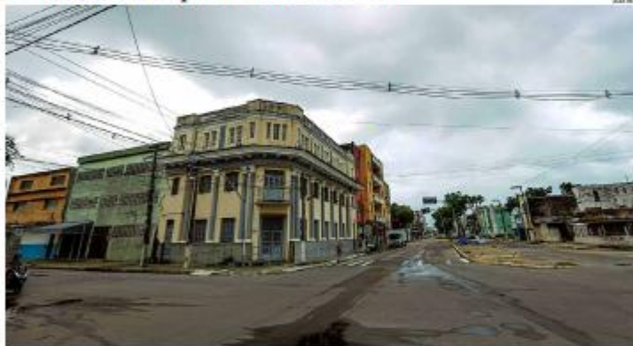
JP NEWS NATAL RUN A segunda edição da corrida, marcada para 21 de junho, terá percurso por pontos históricos da Ribeira e Cidade Alta, com largada na Praça Augusto Severo. As provas de 5 km e 10 km devem reunir cerca de 1.500 atletas profissionais e amadores. • PÁGINA 8 •