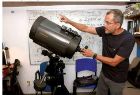
CIÊNCIA O Observatório Astronômico da UFRN deve ser concluído em 2027. Com investimento de R$ 2 milhões, o espaço terá, além de telescópio, laboratório de inteligência artificial e recursos de realidade virtual. • PÁGINA 9 •