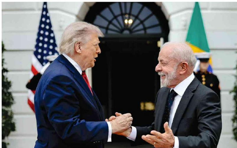
Os presidentes Donald Trump e Lula se cumprimentam em encontro na Casa Branca, em Washington

Aliados de Flávio aditem desgaste e esperam novas operações para definir vice A6