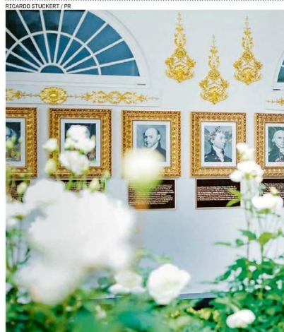
Lula e Trump na Calçada da Fama dos Presidentes, galeria que o líder americano instalou na Casa Branca em 2025, sem a foto de Biden

Divirta-se __C6 e C7 Djavan toca hits de 50 anos de carreira