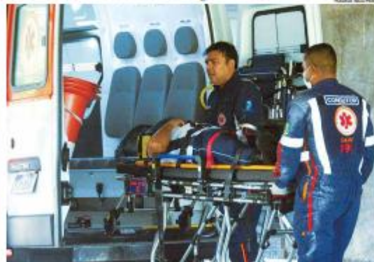
PIED A cada três horas, o Hospital Walfrado Gurgel recebe uma vítima de acidente de moto. Entre janeiro de 2025 e abril de 2026, mais de 4 mil motociclistas foram internados na unidade, aponta LAIS. » PÁGINA 9