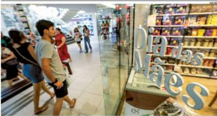
VENDAS Com um movimento crescente, o comércio de Natal espessa alta nas vendas para o Dia das Mães. Consumidores já procuram presentes e lojistas apostam em promoções e facilidades de pagamento. Data deve injetar R$ 482,7 milhões na economia do RN, projeta Fecomércio. → PÁGINA 7

JULGAMENTO O Supremo Tribunal Federal volta a analisar nesta quarta-feira (6) a constitucionalidade da Lei 12.734/2012, que altera a distribuição dos royalties do petróleo entre estados produtores e não produtores. Suspendido desde 2013 por decisão liminar, o julgamento rescende um debate com impacto direto nas finanças públicas. No RN, que arrecadou R$ 621 milhões em 2025 somando estado e municípios, a expectativa é de ganho com a redistribuição. Dados mais recentes apontam que 144 dos 167 municípios potiguarenses perderam R$ 762 milhões de 2013 a 2024. → PÁGINA 7