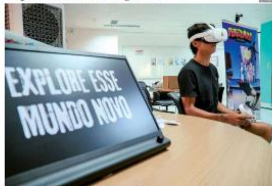
EVENTO O RN Indie Expo, que ocorre de quinta (5) a sábado (8), reúne desenvolvedores potiguarenses no IPD, com programação gratuita que une qualificação, empreendedorismo e exposição de jogos produzidos no estado. → PÁGINA 9