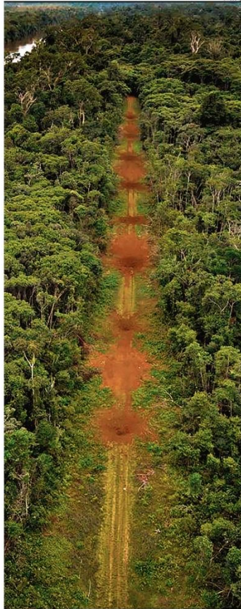
Mata aberta. Pista clandestina usada por grupos criminosos é inutilizada em Roraima

Níveis de colágeno na pele podem cair até 30% cinco anos após a menopausa. Mas existem maneiras de conter os danos e proteger a elasticidade. PÁGINA 25