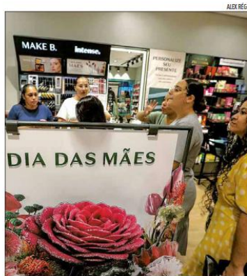
No Alecrim, movimento já é intenso com a proximidade da data

Os valores correspondem às expectativas projetadas pela Câmara de Dirigentes Lojistas de Natal (CDL Natal) para o Dia