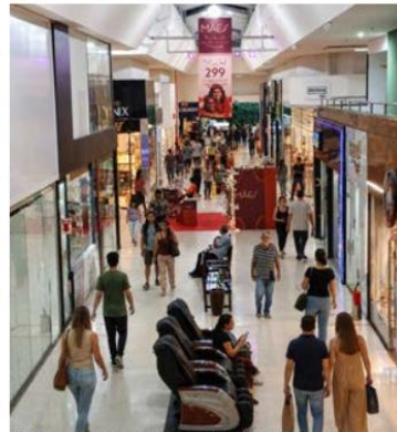
Dia das Mães deve injetar mais de R$ 480 milhões na economia potiguar

Na capital potiguar, 74,6% dos entrevistados indicaram a