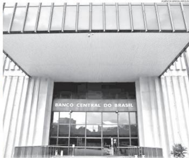
Apesar da previsão de crescimento do PIB ser mantida, o cenário para 2027 aponta para uma desaceleração

A projeção do mercado segue acima da estimativa do próprio Banco Central, que prevê crescimento de 1,6% para 2026, con-