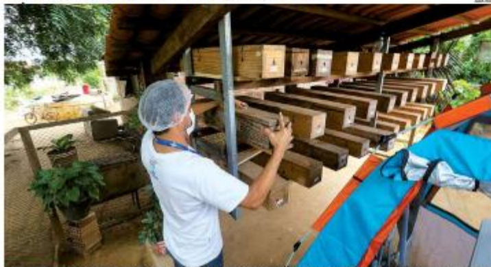
MELIPONICULTURA Produzido por abelhas sem ferrão na Caatinga potiguar, o mel de Jandaíra ultrapassou as divisas do RN e passou a ser reconhecido como ingrediente de excelência. O produto une tradição, sustentabilidade e valorização das comunidades produtoras. » PÁGINA 7