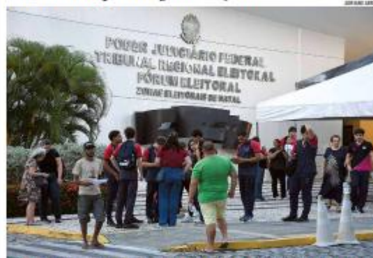
ELEIÇÕES O TRE-RN tem registrado filas na reta final para a regularização do título eleitoral. O atendimento está ocorrendo em horário estendido, e o prazo para os eleitores termina nesta quarta-feira (5). » PÁGINA 9