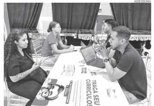
Feira da Empregabilidade vai deixar muita gente apta a um emprego formal

Senac RN de fortalecer a empregabilidade no Estado, ampliando o acesso à qualificação e conectando trabalhadores às deman-