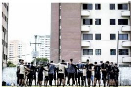
BRASILEIRO SÉRIE D Apenas 24h depois de vencer o clássico contra o América, o elenco do ABC já se reúne para viajar à Paraíba. O time treme pelo cansaço no duelo contra o Sousa, sábado, no Maricão. • PÁGINA 12 •

Em reunião com Sinduscon, prefeitura detalha plano de R$ 1,3 bi em obras