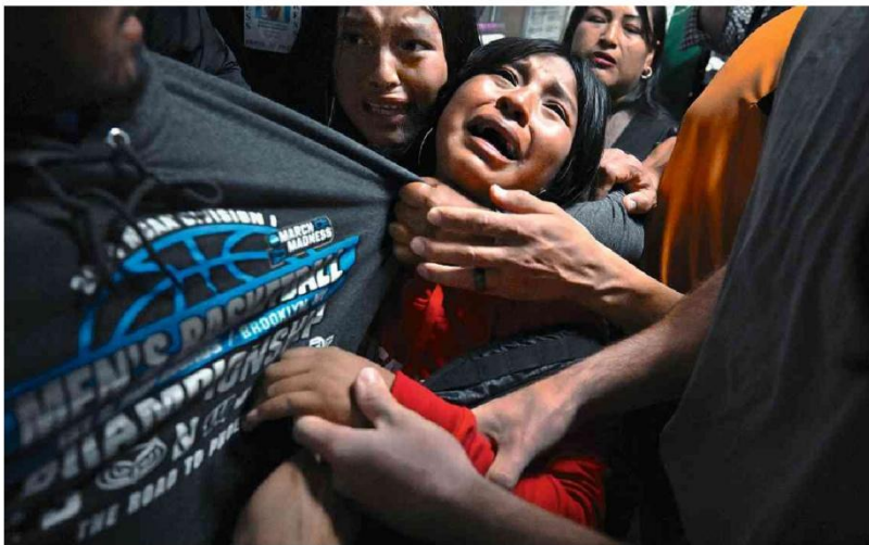
Carol Guzy - 16.ago.2025/Zuma Press/Witness via Divulgação World Press Photo

Gilmar Mendes, do STF, comparou as críticas à corte feitas por Romeu Zema (Novo) a retratar o ex-governador como homossexual e questionou se isso não seria "ofensivo". A7