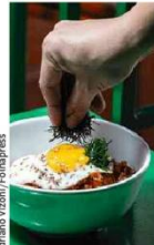
Arroz frito de kimchi e barriga de porco do Nanu