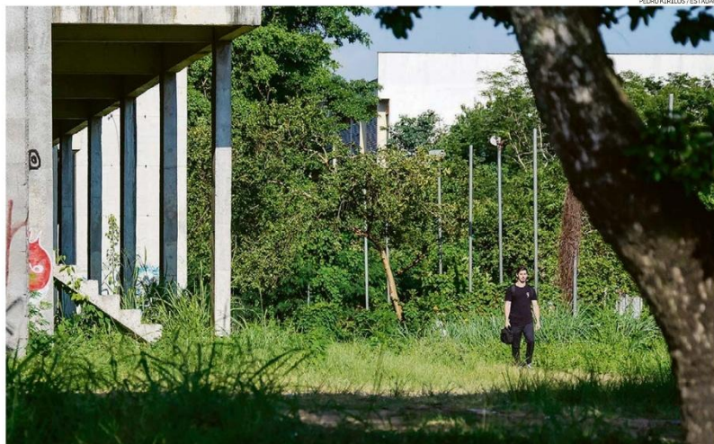
PEDRO KIBELLOS / ESTADÃO

Quinta-feira 23 de ABRIL de 2020 • R$ 7,90 • Ano 147 • Nº 48400 estado.com.br