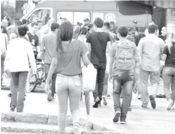
Rio Grande do Norte registra predominância feminina na população, segundo dados da PNAD Continua 2025 do IBGE