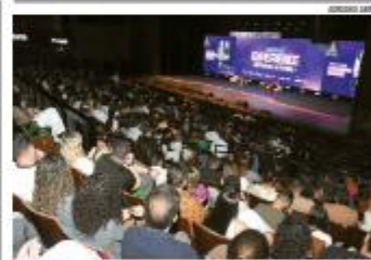
FUTURO A segunda edição do Sebrae Esperanças 2020 reuniu grande público no Teatro Riachuelo com palestras e painéis sobre inovação, liderança e desafios do futuro do empreendedorismo potiguar. » PÁGINA 7 »