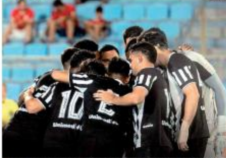
REC O Alvirrogo enfrentou o Imperatriz, no Maranhão, e venceu por 3 a 1, contra D&L, pela Copa do Nordeste. O resultado deixa o time petzugar na liderança do Grupo B. » PÁGINA 12 »