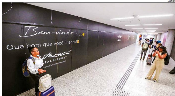
Em 2026, o estado passou a contar com três novas ligações diretas com o exterior. Argentina é o principal mercado

Na avaliação do gestor, a política de incentivo à aviação