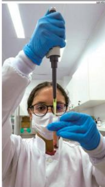
ALERTA Dia Mundial da Hemofilia (17 de abril) chama atenção para o diagnóstico precoce, que ajuda a reduzir riscos, e para o tratamento contínuo da doença, que afeta a coagulação do sangue. » PÁGINA 2 »

O estoque de crédito imobiliário no Rio Grande do Norte em março de 2020 em R$ 15,59 bilhões, com alta de 14,6% em relação ao ano anterior. O FGTN lidera as operações. » PÁGINA 6 »