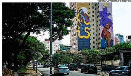
Murais em edifício ao lado do Teatro Oficina na rua Jaceguai, na Bela Vista

esporte Maioria dos brasileiros quer Neymar na Copa, diz Datafolha A46