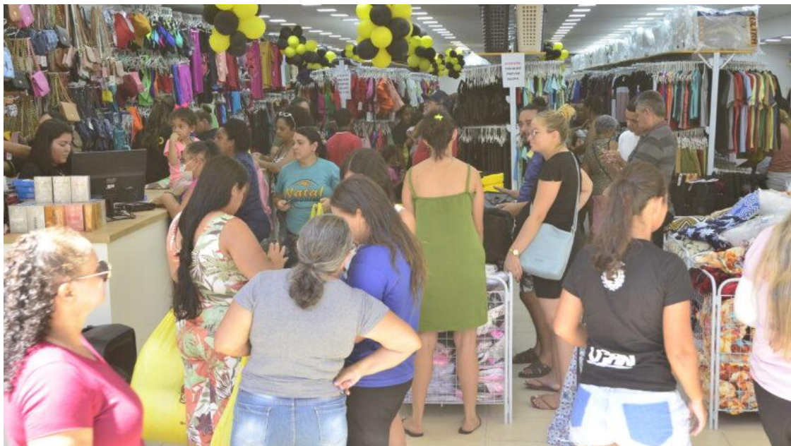
Setores de comércio e serviços vão 'segurar a onda' na economia do RN