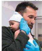
Noah Wyle em cena do drama hospitalar

ilustrada Séries como 'The Pitt' põem especialistas à prova B8