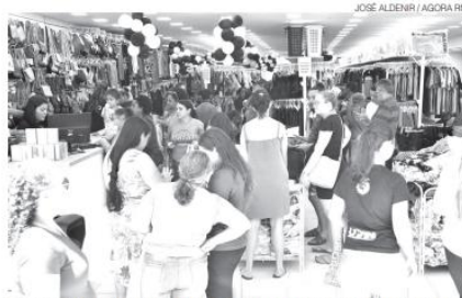
Setores de comércio e serviços vão 'segurar a onda' na economia do RN

As estimativas setoriais reforçam o cenário de instabilidade. Enquanto o Produto Interno Bru-