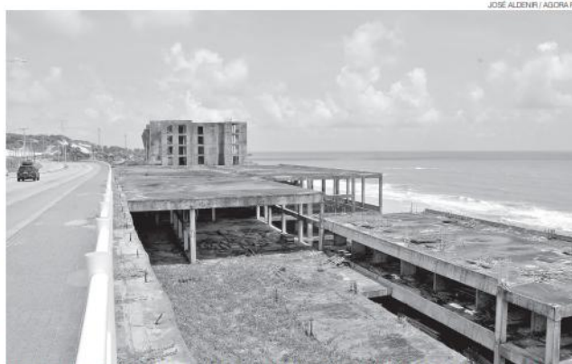
Exemplo clássico de entraves jurídicos e concessões irregulares que deixaram Natal atrás de outras capitais

Além do impacto direto no setor, a expansão da infraestrutura