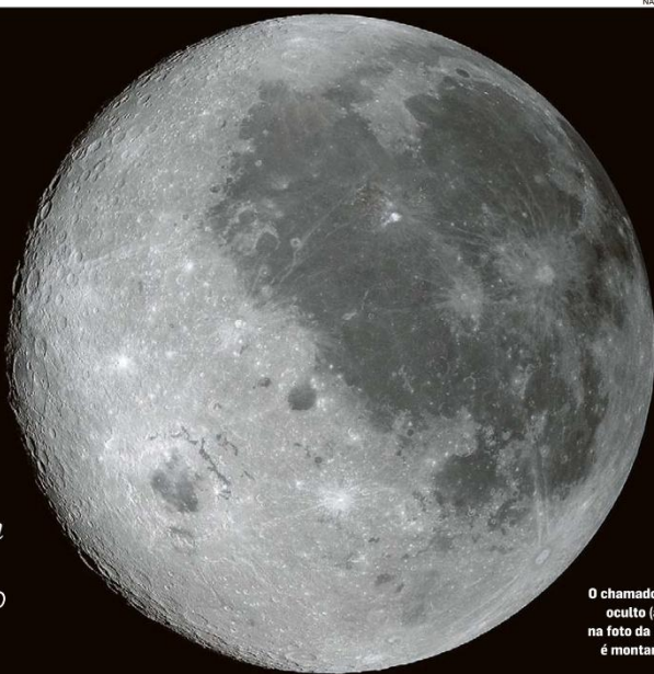
O chamado lado oculto (à esq. na foto da Nasa) é montanhoso

Equipe chega a 406.778 km da Terra e bate o recorde da nave Apollo 13, de abril de 1970