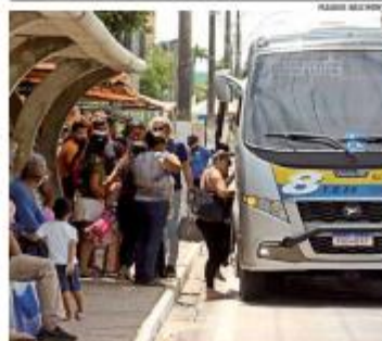
TRANSPORTES A paralisação do transporte intermunicipal no RN provocou transtornos na manhã desta segunda (6), com paradas lotadas e longas esperas. Sistema voltou a funcionar a tarde, após acordo. « PÁGINA 9 »

RIQUEZA Patrimônio da família de Moraes triplica em cinco anos no SIF. « PÁGINA 5 »