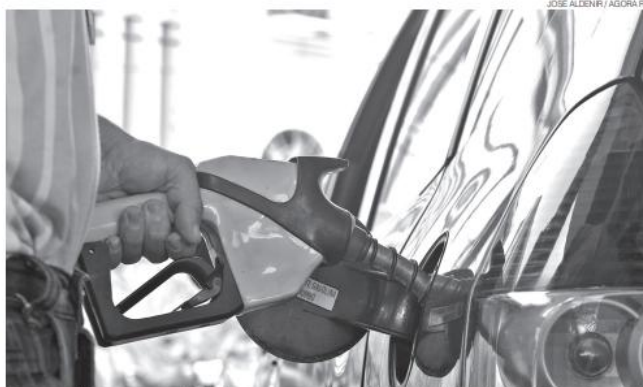
Expectativa é de que os preços não se elevem com zeragem do PIS e Cofins com subsídio de R$ 1,20 por litro diesel

A posição do Rio Grande do Norte foi divulgada após o tema ser discutido por cerca de seis horas em uma reunião do Conselho Nacional de Política Fazendária (Confaz). O colegiado reúne os secretários estaduais de Fazenda e é presidido pelo