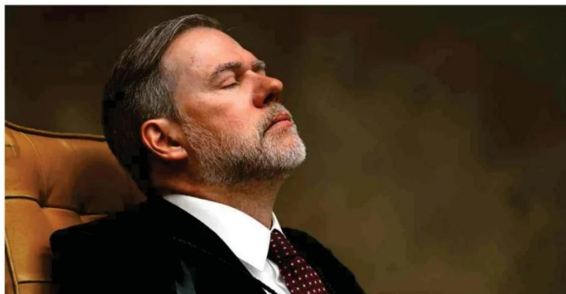
O ministro Dias Toffoli em sessão plenária do STF, antes de reunião convocada por Fachin para discutir relatório da PF.

À noite, após o afastamento, os ministros do Supremo publicaram nota conjunta em que defendem Toffoli, afirmando "não ser caso de cabimento para arguição de suspeição" do colega. Assim, disseram, os atos do ministro na relatoria do caso Master continuam válidos. Economia A13 a A15