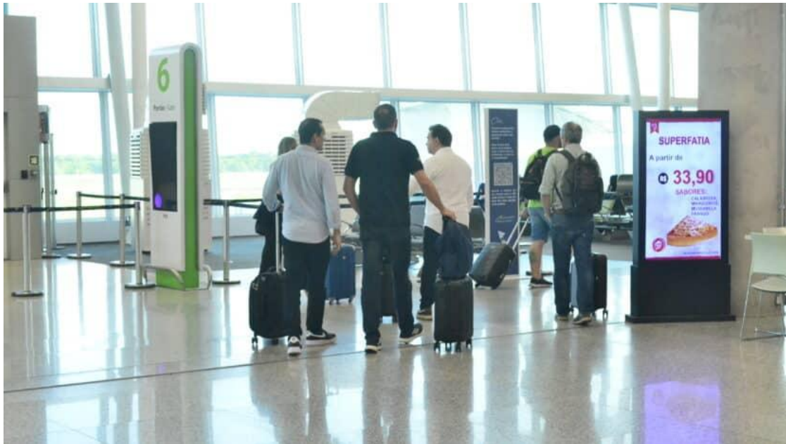
Aeroporto de Natal

O Iatur reúne 22 das 166 atividades de serviços investigadas na pesquisa e que são ligadas à atividade turística, como hotéis, agências de viagens, bufês e transporte aéreo de passageiros.