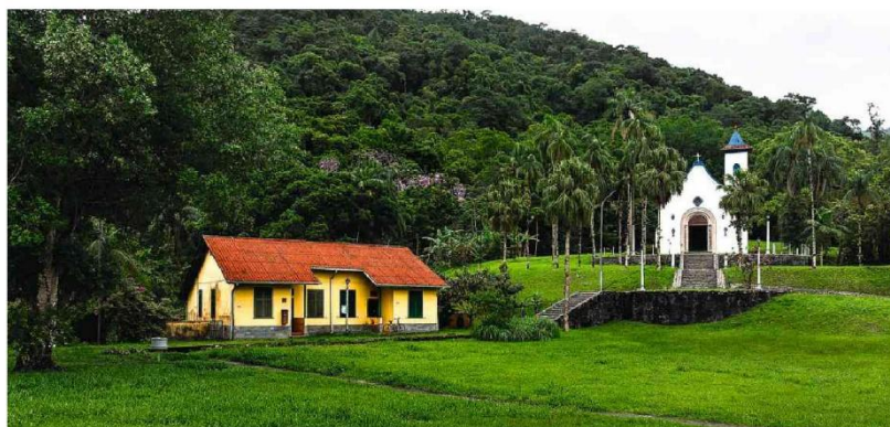
Vila de Itatinga, em Bertogiã, construída em 1910 para receber trabalhadores de usina que abastecia o porto

Integrantes do governo afirmam que a liberação recorde é resultado de esforço para melhorar a relação com o Congresso, no ano em que Lula deve disputar a reeleição. Em 2025, a gestão petista foi alvo de reclamações até de sua base, em razão da baixa execução dos recursos indicados pelo Legislativo. Política A6