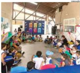
ABERTURA DAS AULAS O ano letivo foi aberto na rede municipal de Natal, com cerca de 50 mil alunos matriculados da pré-escola ao ensino fundamental. Nas creches e pré-vestibulares, restam 100 vagas. » PÁGINA 8

Ano 75 • Número 222 • Terça-feira, 10 de fevereiro de 2026