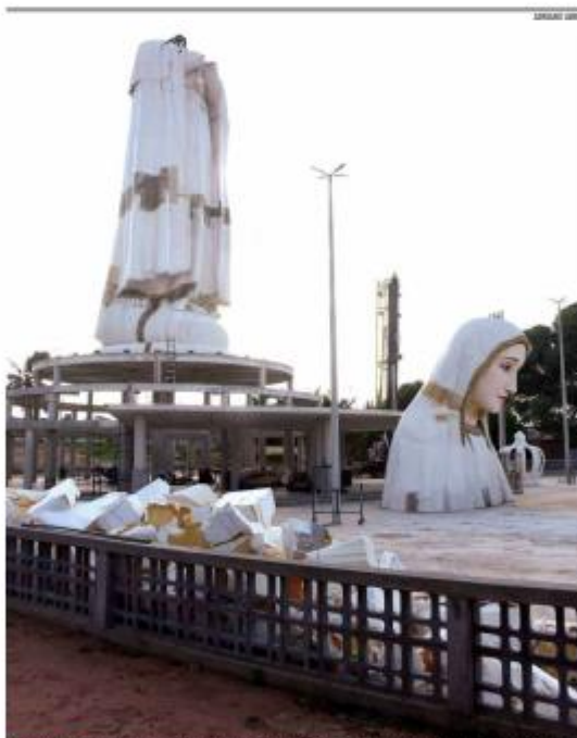
MONUMENTO A montagem da estátua de Nossa Senhora de Fátima, na zona Norte de Natal, deve terminar em fevereiro. Já a pintura e acabamentos seguem até abril. Prefeitura ainda não tem data para inauguração. » PÁGINA 6

Chuves em Natal pausam posts de Natal e Mineiro nas redes sociais. » PÁGINA 2