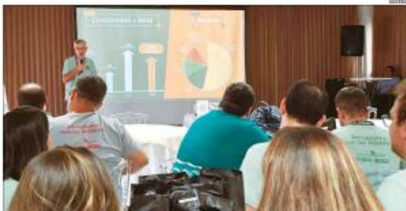
Convenção do Sistema Tribuna de Comunicação teve a apresentação dos resultados de 2025 e das metas para 2026