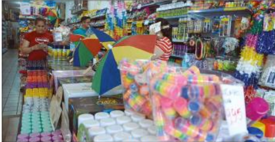
Itens como espumas, sprays de cabelo e fantasias estão entre os mais vendidos no comércio

ano anterior. "Mais de R$ 196 milhões foram injetados na economia da cidade em 2025 com a movimentação do Carnaval, e uma parcela importante dessa movimentação passa pelo comércio de rua, gera empregos temporários também. O período é muito bom para vários segmentos", pondera. De acordo com a Câmara de Dirigentes Lojistas de Natal (CDL), o fluxo de pessoas nas prévias carnavalescas, bem como os eventos oficiais deverão trazer um grande impulso para o comércio local. O aumento no fluxo turístico também contribui para a elevação do ticket médio e do volume de compras na cidade. "O Carnaval se diferencia por ser uma data que movimenta simultaneamente vários setores da economia. Enquanto em períodos tradicionais o crescimento se concentra em segmentos específicos, no Carnaval há impacto direto no varejo e no setor de serviços", disse José Lucena, presidente da CDL Natal. De acordo com dados nacionais do SCP Brasil, a intenção de consumo para o período carnavalesco apresenta alta média entre 6% e 8% em relação a períodos comuns do ano. Em Natal, de acordo com a CDL, o comércio projeta um