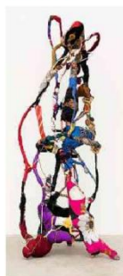
Obra da artista mineira da série 'Torção'