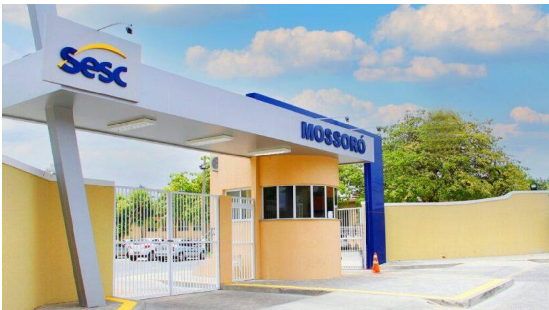
Escola Sesc Mossoró - Foto: Divulgação

Desenvolvido para orientar e conscientizar empresas do setor alimentício, o Programa Alimentos Seguros tem como objetivo principal reduzir a incidência de doenças transmitidas por alimentos contaminados, além de contribuir para a diminuição do desperdício e o aumento da competitividade dos serviços de alimentação. Ao conquistar o selo, o Sesc RN reforça seu compromisso institucional com a promoção da saúde, do bem-estar e da excelência nos serviços prestados à população.