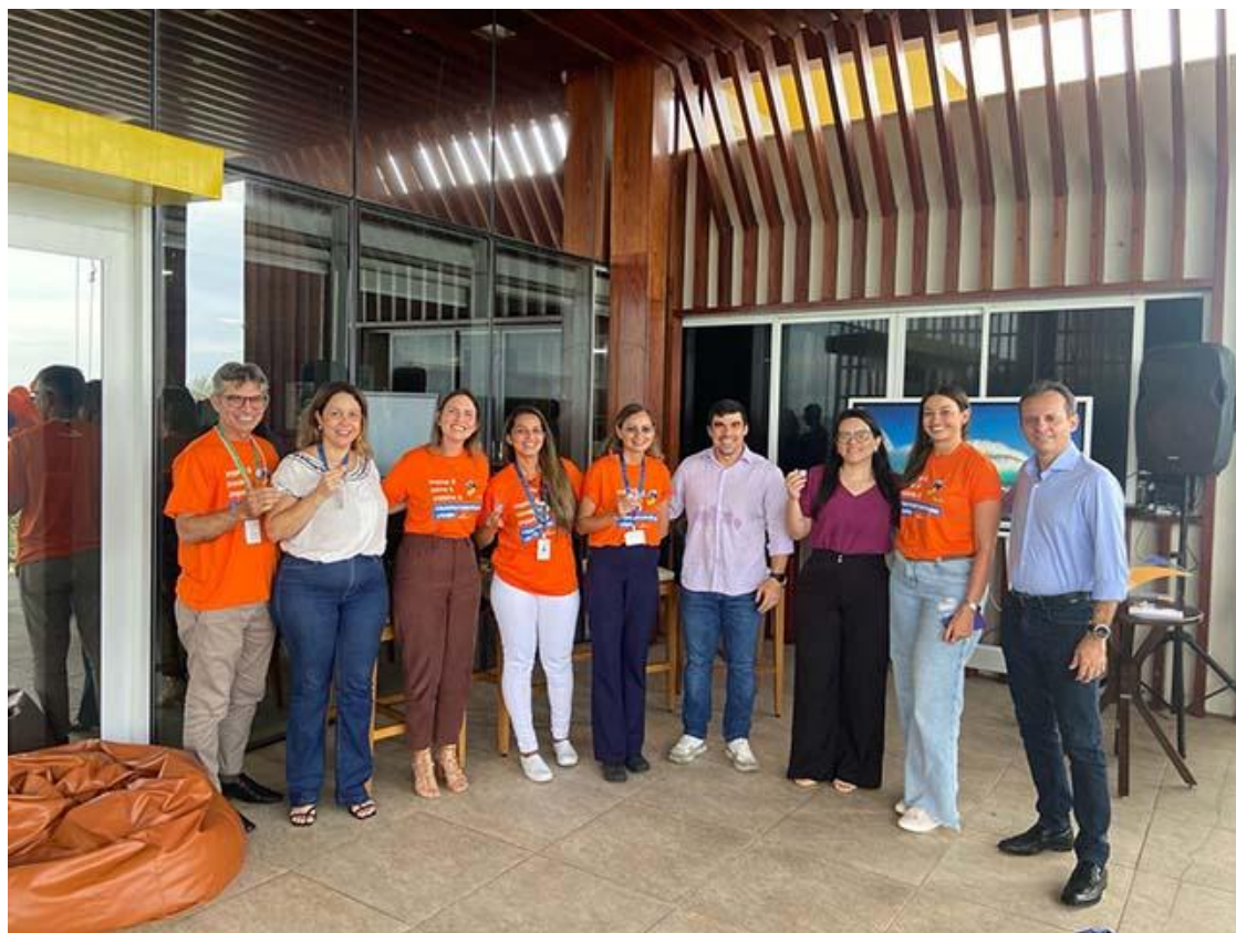
Equipe do Senac Barreira Roxa