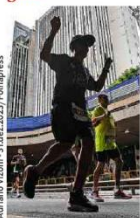
Corredores na 100ª São Silvestre, em 2025

CORRIDAS EM SÃO PAULO PARA O ANO INTEIRO