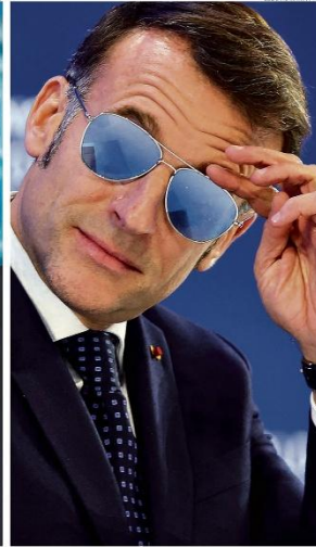
Resposta. Macron usava óculos por causa de um sangramento no olho