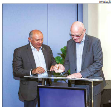
Acordo de cooperação foi assinado nesta terça-feira