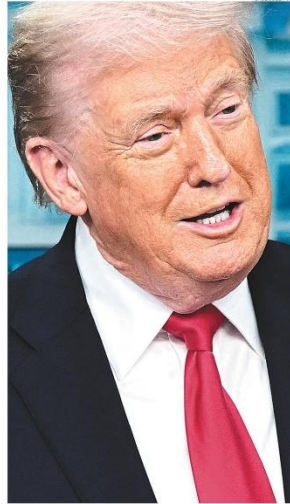
No ataque, Trump ampliou ameaças aos aliados europeus

O presidente dos EUA, Donald Trump, agravou a crise com a Europa ao ampliar as ameaças de uma ação militar para tomar o controle da Groenlândia. Em publicações nas redes, ele exibiu montagens de uma anexação do território e expôs mensagens de líderes europeus. Em reação, o Parlamento Europeu anunciou ter maioria para congelar o acordo comercial assinado em julho com os EUA que deu trégua na guerra tarifária trumpista. O francês Emmanuel Macron declarou que o americano quer "subordinar" a Europa, em defesa ecoada pela chefe da Comissão Europeia, Ursula von der Leyen. A reação não ficou só na Europa. O primeiro-ministro do Canadá, Mark Carney, disse avaliar que o mundo vive uma "ruptura". No Brasil, Lula criticou Trump por querer "governar o mundo pelo Twitter". PÁGINA 17