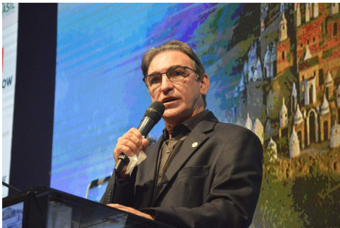
Queiroz: Melhoria da infraestrutura é condição para atrair investimentos

Um dos principais entraves apontados é o gasto elevado com pessoal. Embora o RN tenha iniciado uma redução gradual desse indicador em 2025, a despesa com salários ainda consumiu 55,73% da receita corrente líquida no segundo quadrimestre do ano, acima do limite de 49% previsto pela Lei de Responsabilidade Fiscal para o Poder Executivo. O Estado segue como o que mais gasta com pessoal no País, em termos proporcionais.