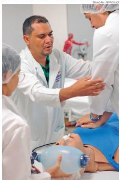
Mais de 80 milhões de pessoas já tiveram suas vidas transformadas pelo Senac