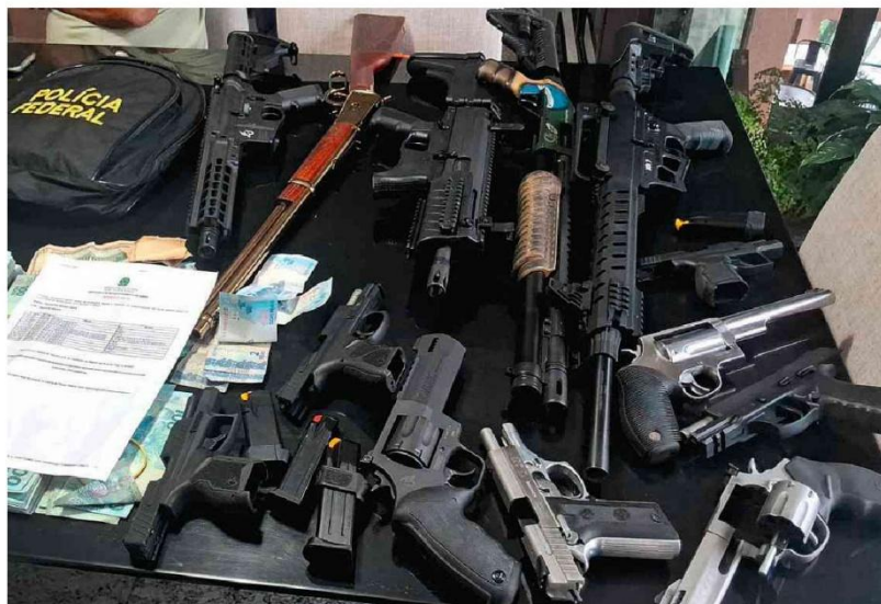
Parte das 30 armas apreendidas pela PF; R$ 626 mil em espécie e 23 veículos também estão na lista

Durante o dia, o ministro havia determinado que o material apreendido fosse lacrado e ficasse sob guarda do STF, o que é inusual. Depois, reconsiderou a decisão e determinou que as provas fiquem com a PGR. Alvos da operação se dizem à disposição das autoridades. Economia A11 a A13