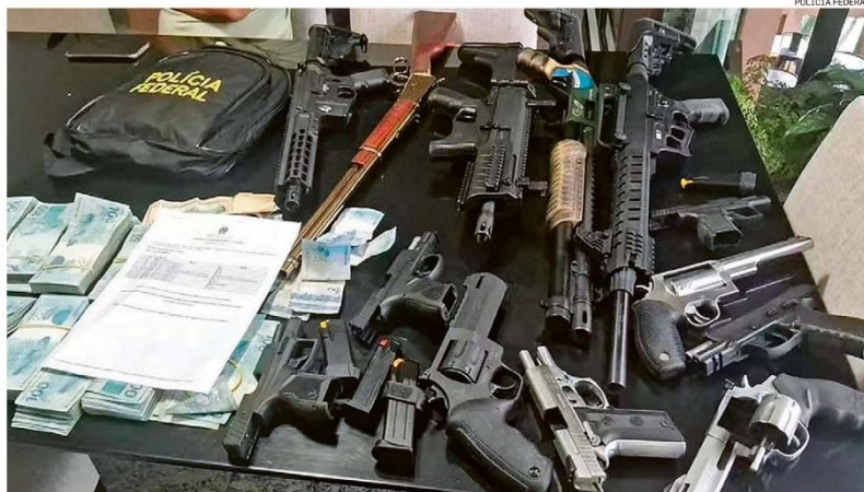
Trinta armas foram encontradas pela PF num endereço em MG; também foram apreendidos 23 veículos, relógios e R$ 645 mil em dinheiro