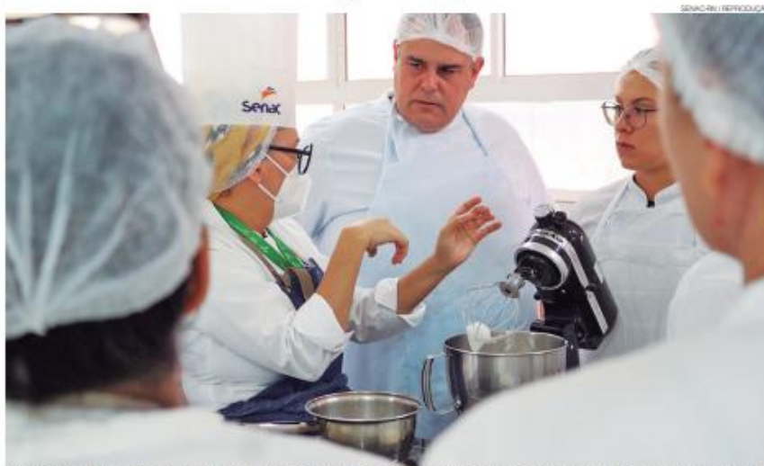
Serviço Nacional de Aprendizagem Comercial vem, desde 1946, impulsionando o comércio e contribuindo para o fortalecimento socioeconômico em todo o Brasil