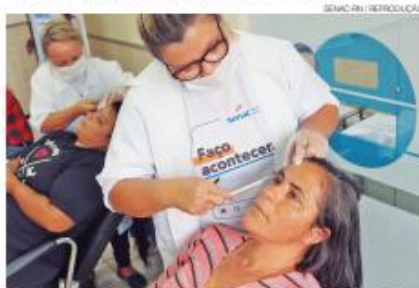
Em 2025, Senac RN alcançou 35 mil matrículas, com mais de 3 milhões de horas-aula

tem desempenhado um papel estratégico na ampliação do acesso à educação profissional no Estado. Em 2025, a instituição alcançou 35 mil matrículas, somando mais de 3 milhões de horas-aula, ofertadas em 148 municípios potiguaros, o que corresponde a 88,6% do território do Rio Grande do Norte.