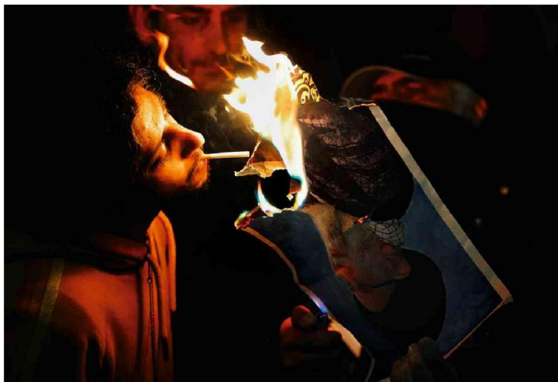
Foto do aiatolá Ali Khamenei é queimada em Londres, em protesto que virou símbolo ao ser protagonizado por mulheres

Defensoria Pública de SP, 20 anos Sobre objetivos e deficiências do órgão, que segue o corporativismo da Justiça.