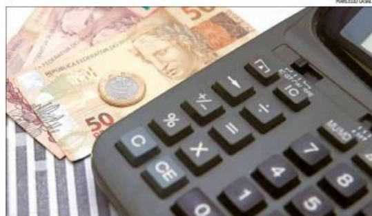
A meta de inflação para 2026 é 3%, com tolerância de 1,5 ponto percentual para cima ou para baixo

deverá ser reduzida dos atuais 15% para 12,25% até o final de 2026, segundo o mercado financeiro; e para 10,50% em 2027. Para o ano subsequente (2028), as expectativas são de que ela caia ainda mais, para 9,88%.