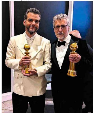
Wagner Moura com o prêmio de melhor ator de drama e Kleber Mendonça Filho com o de filme de língua não inglesa