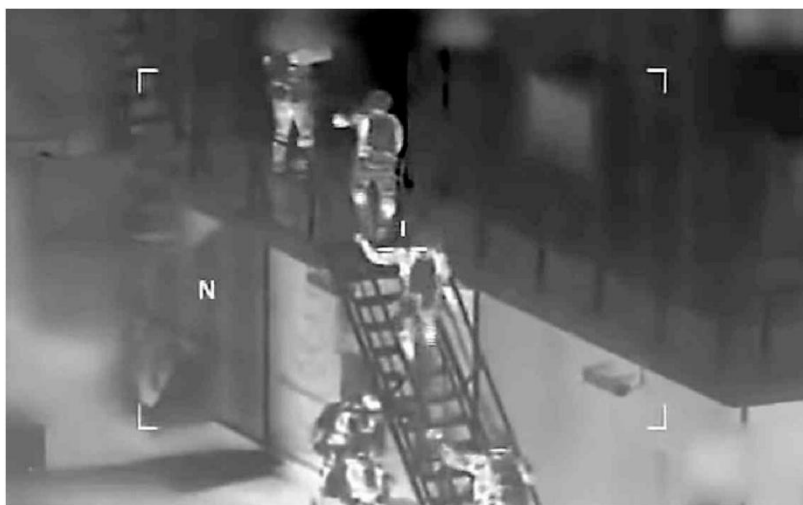
Forças norte-americanas tomam navio de bandeira russa com petróleo venezuelano que navegava no Atlântico Norte