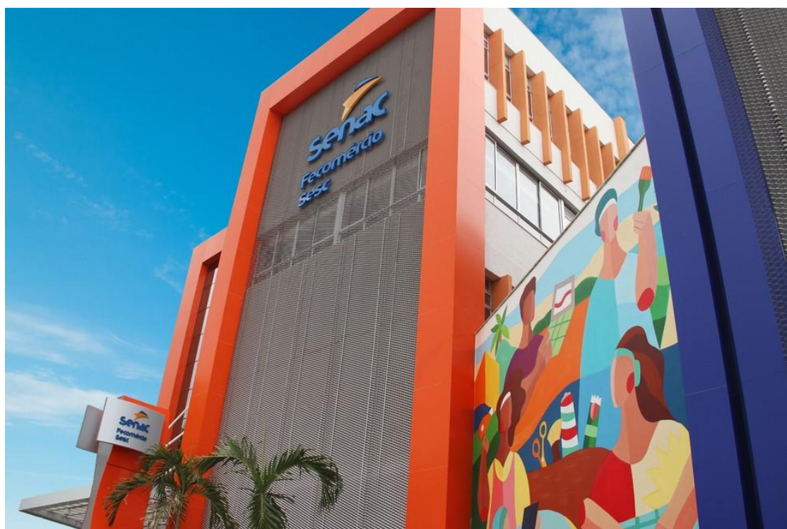
Senac-RN prédio fachada frente

Senac-RN abre 260 vagas para mulheres em cursos gratuitos na área de tecnologia da informação; veja como se inscrever