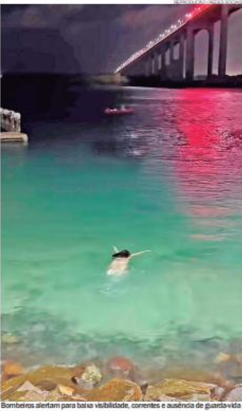
Bombeiros alertam para baixa visibilidade, correntes e ausência de guarda-vidas

O Corpo de Bombeiros Militar do Rio Grande do Norte (CBMRN) emitiu alerta à população sobre os riscos do banho de mar durante a noite, prática que tem ganhado visibilidade nas redes sociais, especialmente na praia da Redinha. Segundo a corporação, no período noturno a visibilidade é reduzida, o que dificulta a identificação de buoços, pedras, animais marinhos e correntes de retorno, aumentando significativamente o perigo para os banhistas.