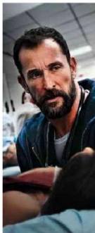
O ator Noah Wyle como o doutor Robby na série Divulgação