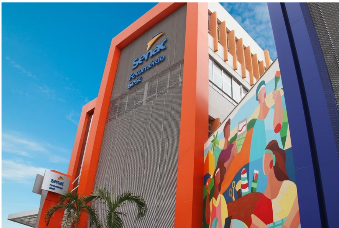
Senac-RN prédio fachada frente

Inscrições para cursos gratuitos do Conectando Mulheres - Senac Code seguem até dia 10 de janeiro pelo site do Senac. Aulas tem previsão de começarem em 19 de janeiro, em Natal.