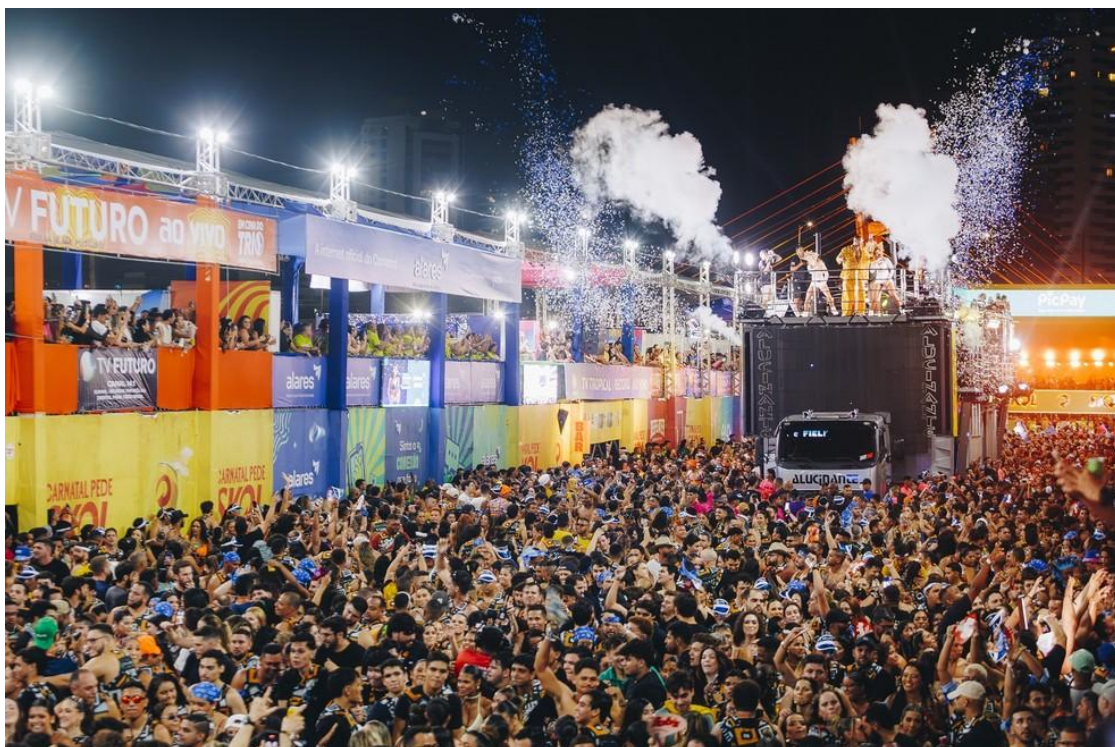
Carnatal 2025

Um dos eventos mais esperados do calendário cultural do Rio Grande do Norte, o Carnatal 2025 foi além da festa na avenida e causou impacto na economia de Natal. De acordo com levantamento do Instituto Fecomércio RN, o evento movimentou R$ 155 milhões, representando um crescimento de 37,6% na comparação com 2024.