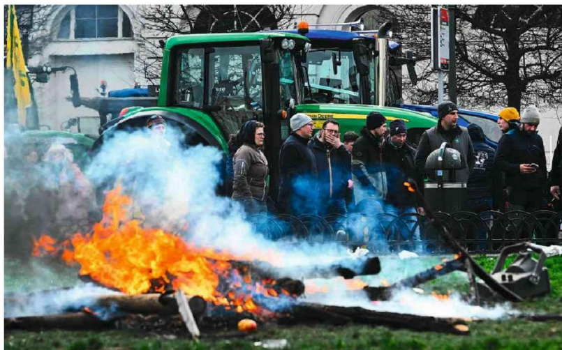
Agricultores protestam perto do Parlamento Europeu, em Bruxelas, contra acordo do bloco com o Mercosul

Presidente confirma veto a redução de penas e nega acordo com Congresso A8