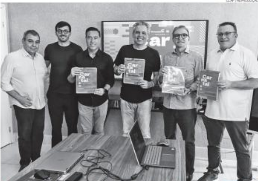
Diretores da Clap Entretenimento receberam resultado da pesquisa nesta quinta, de diretores da Fecomércio RN

O perfil do público revela uma mudança estrutural. Em 2022, re-