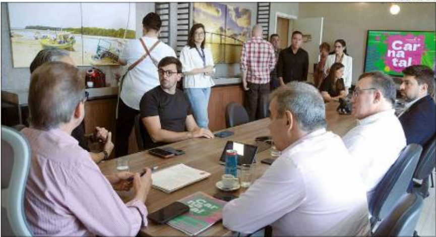
Números foram apresentados durante uma coletiva de imprensa. Carnatal 2025 contou com um público de 130 mil pessoas

"O Carnatal tinha como meta alcançar 42% de share de participação de turistas nessa edição. Nós batemos esse número e fomos