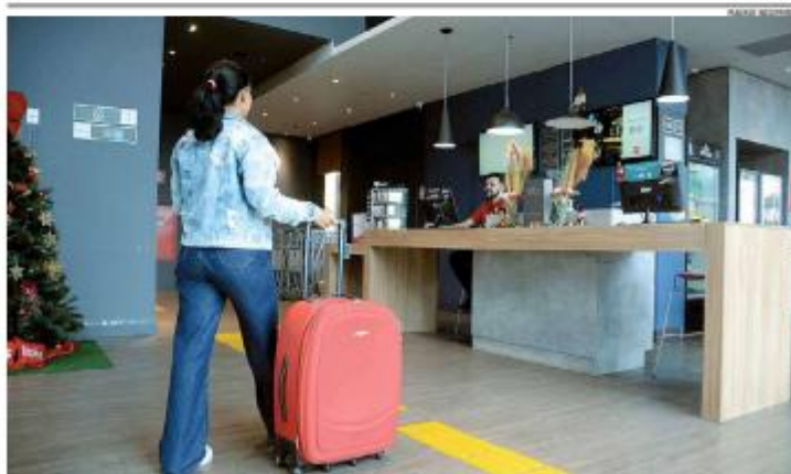
CHECK-IN Nova portaria do Ministério do Turismo, já em vigor, redefine a diária como período de 24 horas, institui a Ficha Nacional de Registro de Hospedes eletrônica para pré-check-in e, segundo a ABTH-RN, amplia a segurança jurídica e a transparência na relação entre hotéis e hóspedes. » PÁGINA 9

Com o aumento da demanda por energia elétrica, a Neoenergia Cuzco apresentou o Plano Verão 2025/2026 para o estado, prevendo reforço das equipes operacionais, ações preventivas e a instalação de duas novas subestações. » PÁGINA 9