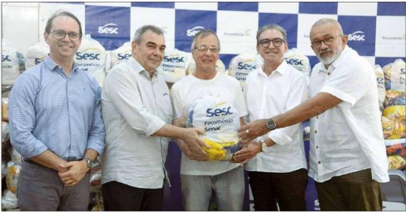
Volume arrecadado é o recorde do projeto em 2025. A estimativa é de que 6 mil famílias serão beneficiadas

"São instituições acompanhadas pelo Sesc por meio de nutricionistas, que orientam como usar os alimentos, além