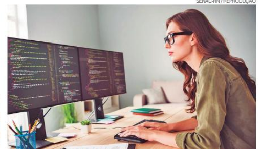
Projeto soma mais de 83 mil horas de capacitação, distribuídas em 13 turmas

A expectativa é que, ao final do projeto, as participantes não apenas ingressem no mercado de trabalho formal, mas também sejam estimuladas ao empreendedorismo e à geração de renda, com potencial de impacto indireto sobre cerca de 780 pessoas, considerando famílias