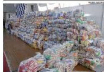
ALIMENTOS O projeto Sesc Mesa Brasil doou 26 toneladas de alimentos a 145 entidades do RN, resultado de uma parceria com três grandes eventos: Carnatal, Baile do Rogerinho e Rêveira Boêmia. » PÁGINA 9