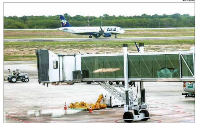
No RN, dos 28,7 mil visitantes internacionais, 11,3 mil vieram da Argentina, principal emissor

A Fecomércio/RN atribui os números à desvalorização cambial e à promoção do estado no exterior. A entidade destaca que o total de chegadas de turistas estrangeiros nos últimos 11 meses já supera o total de desembarques estrangeiros no estado nos anos fechados do período pré-pandemia, de 2018 (28.127) e 2019 (26.551).