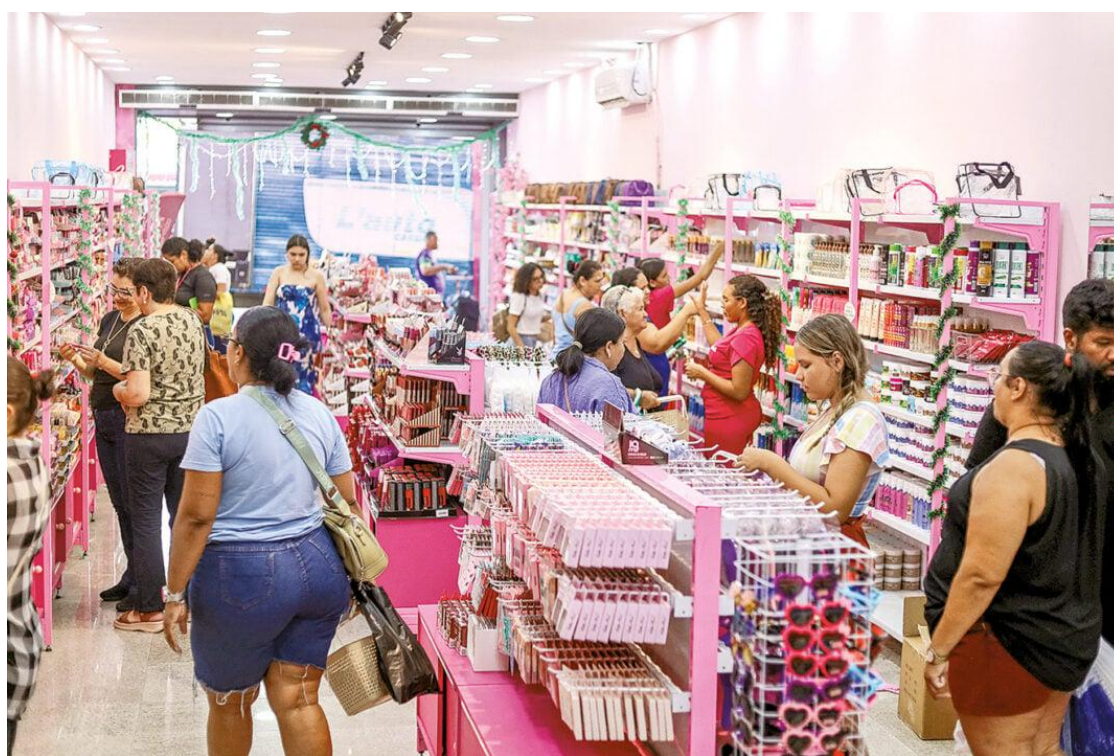
Amigo secreto tem elevado o movimento em lojas do Alecrim

Amigo secreto deve movimentar R$ 20 milhões no comércio da capital, aponta pesquisa