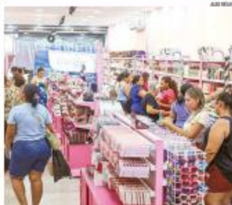
PRESENTES Tradicional no calendário de fim de ano, o amigo secreto deve movimentar cerca de R$ 20 milhões no comércio de Natal, segundo levantamento da CNI e do SPC Brasil. » PÁGINA 7 »