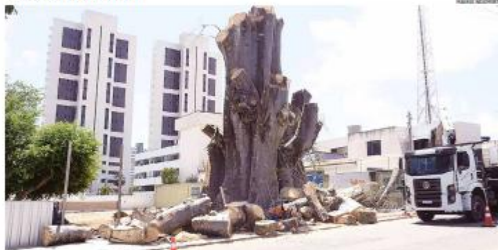
NATUREZA A poda do Baobá do Porto, na Rua São José, entrou na fase final e deve ser concluída até o fim desta semana. A árvore centenária está sendo reduzida a cerca de três metros de altura após laudos técnicos apontarem risco estrutural causado por fungos e necrose interna. » PÁGINA 9 »