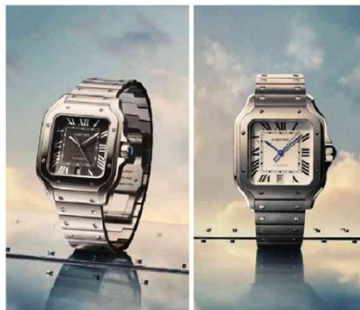
Novos modelos icônicos de Cartier, Santos em Aço com Mostrador em Preto (à esq.) e Santos Titanium (à dir.)

Já o modelo em aço com mostrador preto aposta no visual esportivo e contemporâneo. O destaque fica por conta dos ponteiros revestidos com Super-Luminova® verde fluorescente, tecnologia que ilumina o mostrador e garante excelente legibilidade em qualquer situação. A