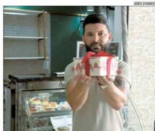
O faturamento da empresa Ricardo Buffet já aumentou 50%