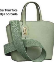
C de Cartier Mini Tote Bag com a alça bordada

um dos relógios mais emblemáticos da relojoaria mundial, e mostra que tradição e ousadia andam lado a lado no pulso de quem não abre mão de estilo, inovação e espírito aventureiro.