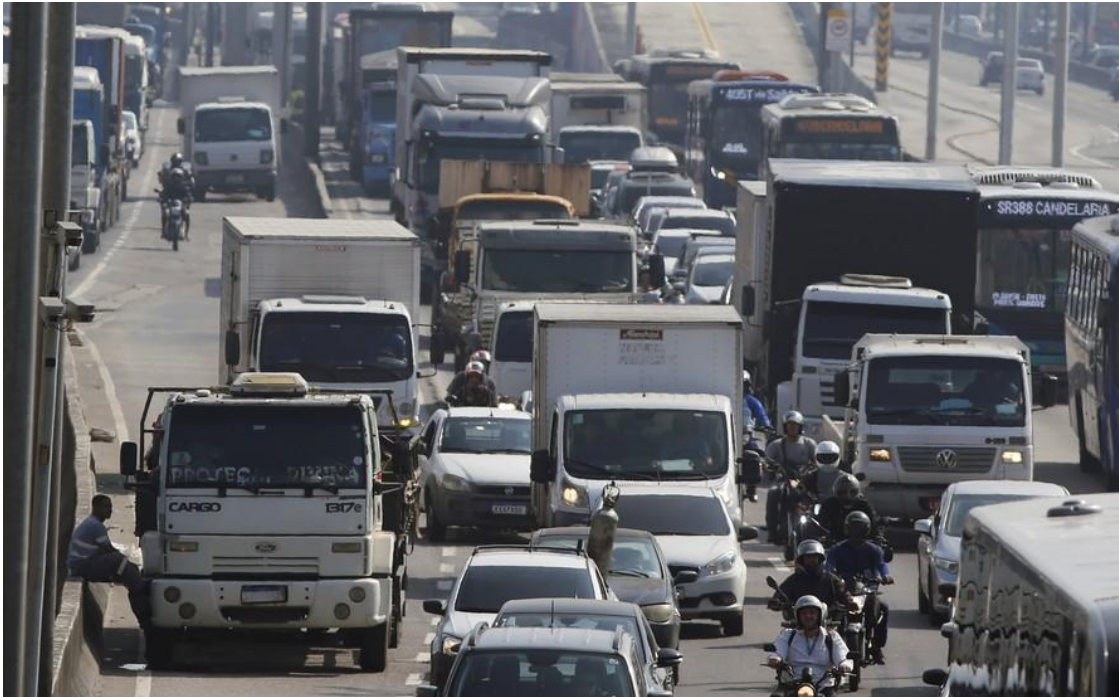
Setor de transporte rodoviário de cargas ajudou a puxar os serviços para cima

Resultado foi puxado principalmente pelo transporte aéreo e o rodoviário de cargas e veio em linha com as expectativas de analistas