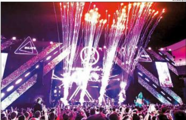
Após o desfile dos blocos, a festa continua com experiências exclusivas para cada público

Domingo (7/12) Corredor da Folia: Ivete Sangalo | Bell Marques | Graffith Largo dos Reis: encerramento na Arena das Dunas Camarote Skol: Durval Lety | Simone Mendes | Rafa & Pipo