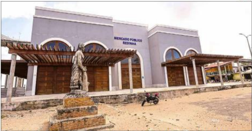
Mercado da Redinha foi reformado e posteriormente oferecido à iniciativa privada para concessão. Edital deu deserto