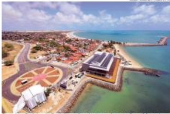
Complexo Turístico da Redinha será reaberto na alta estação, até fevereiro