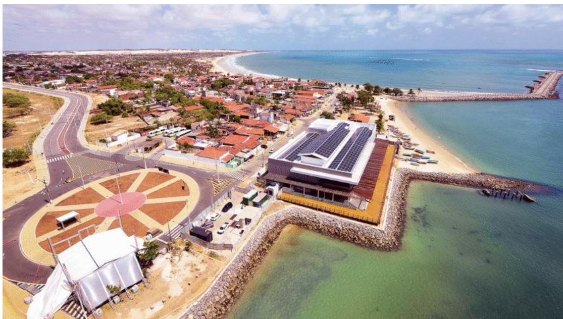
Complexo Turístico da Redinha será reaberto na alta estação, até fevereiro

Ele destacou que, mesmo com o apoio da Fecomércio, a responsabilidade será da própria Prefeitura. “A Prefeitura está abrindo o Mercado com a gestão própria, com a articulação de várias secretarias e tendo o apoio institucional da Fecomércio através de uma cooperação para oferecer qualificação profissional para os permissionários”.