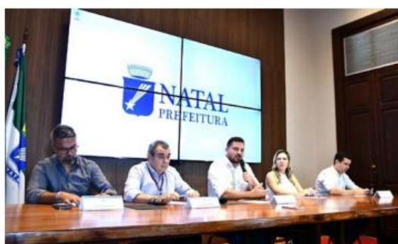
Atividades do Complexo em andamento durante coletiva de imprensa que reuniu secretários municipais e representantes da Fecomércio/RN

ris quanto na oferta de serviços e atividades culturais para o público. Entre as ações já previstas, o Sesc disponibilizará unidades móveis de saúde, biblioteca e cozinha, além de promover apresentações culturais gratuitas ao longo do funcionamento.