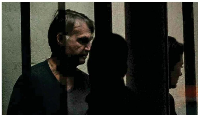
Bolsonaro acompanha com um agente a mulher, Michelle (dir), até a saída da sede da PF em Brasília, onde está preso

Aliados do bolsonarismo no campo da direita já fazem cálculos sobre o impacto do episódio na eleição presidencial de 2026. Para eles, o papel do filho Flávio na trama o inviabiliza como candidato do grupo à sucessão de Lula (PT). Política A6 a A14