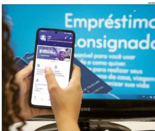
Consignado CLT: a média do valor contratado por trabalhador brasileiro é de R$ 5.245,80; no RN, esse valor é de R$ 5.245,80