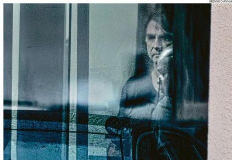
À porta. Bolsonaro aparece próximo ao portão da sede da PF após acompanhar a saída de Michelle, que foi visitá-lo

Em depoimento na audiência de custódia em que a Justiça decidiu manter sua prisão preventiva, o ex-presidente Jair Bolsonaro alegou que sua atitude de tentar violar a tornozeleira eletrônica com uma solda ocorreu devido a uma "confusão mental" e alucinações provocadas por remédios. Ele afirmou que tinha uma "certa paranoia" de que haveria uma escuta no equipamento. A defesa reforçou as alegações por escrito ao STE, argumentos ratificados ainda pelo boletim da equipe médica de Bolsonaro, que citou uma combinação inadequada de medicamentos prescritos por profissionais diferentes. O ex-presidente recebeu ontem a visita de Michelle, sua mulher, no primeiro dia na sede da PF. PÁGINAS 4 e 12