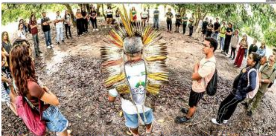
<b>#INDÍGENA 10</b> A comunidade Kati, entre Galimã e Canguatama, aposta no turismo comunitário para valorizar sua cultura, gerar visibilidade para os povos originários do RN e criar novas fontes de renda. A iniciativa oferece roteiros interativos que conectam visitantes às ancestralidades indígenas e promove a sustentabilidade. <b>#MANTA 11</b>

<b>#NEGÓCIOS 10</b> O setor industrial do Rio Grande do Norte cresceu 87,4% de 2020 a 2024, com a criação de 6.299 novos estabelecimentos, totalizando 13.593, conforme dados do Atlas da Indústria Potiguar. A construção civil e a indústria de transformação foram os principais impulsionadores desse aumento, com destaque para a geração de empregos, que subiu 19,3%, alcançando 129.363 postos de trabalho. Agora, a Fiem quer impulsionar o campo das energias renováveis no Estado. <b>#MANTA 11</b>