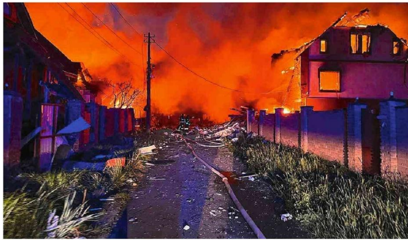
Bombeiros trabalham para conter fogo após mega-ataque da Rússia na região de Kiev, na Ucrânia

O Ministério da Gestão afirma que está tratando do assunto para regularizar a situação, mas buscando adequar demandas à necessidade de equilíbrio das contas públicas. Mercado A14