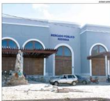
Prefeitura vai apresentar as perspectivas para o complexo da Redinha ao trade turístico

MERCADO Representantes do setor de turismo reforçam a importância do equipamento para a economia local, mas divergem acerca de uma possível reabertura imediata. Reunião vai discutir o tema na próxima segunda-feira (31)