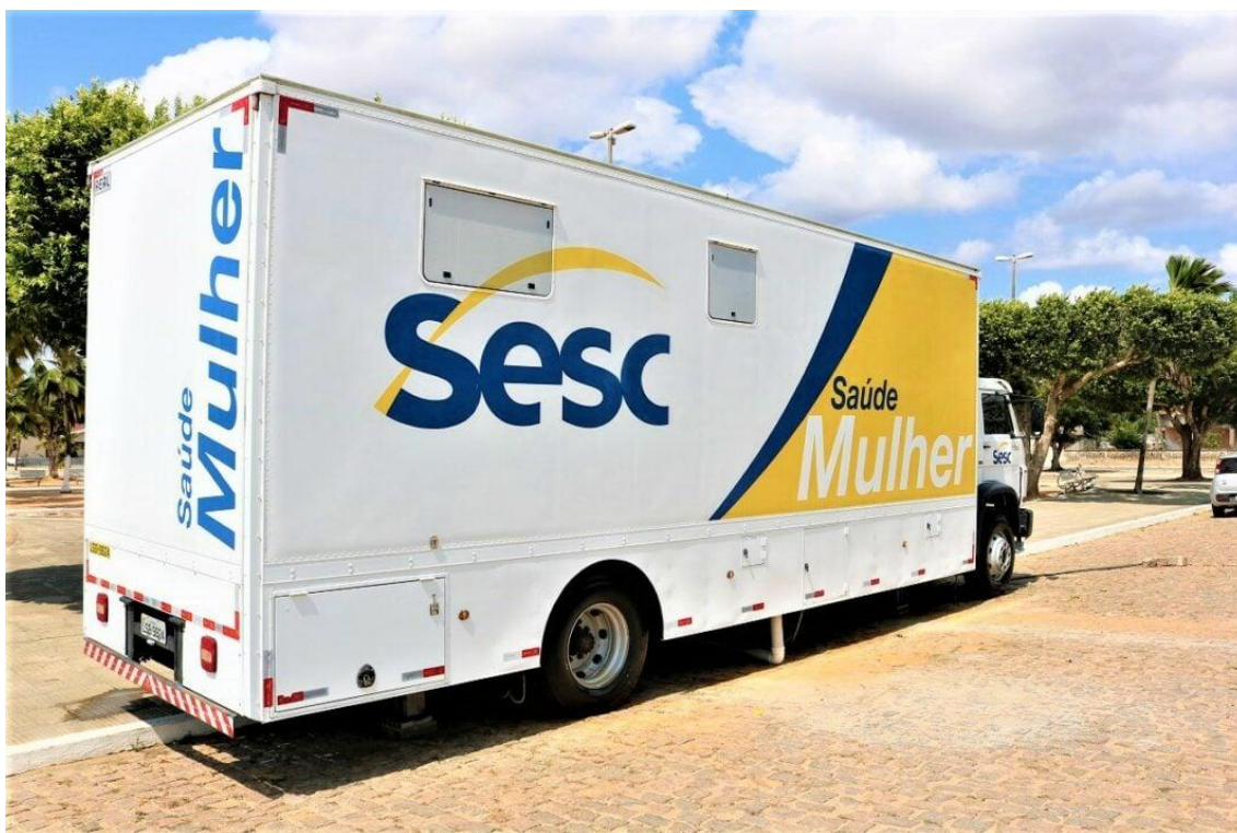
Unidade movel saude mulher

Unidade móvel do Sesc Saúde Mulher oferta 1.750 atendimentos gratuitos em Jundiá