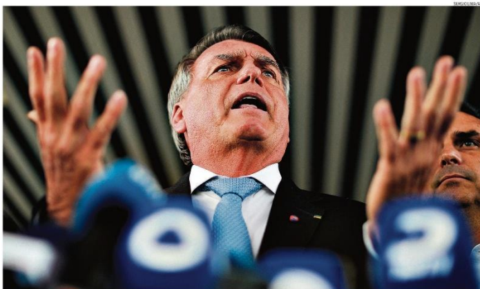
Defesa. Bolsonaro não foi ontem em sessão do STF, como havia feito na terça. Em pronunciamento, ele negou ter articulado golpe e disse ter sido prejudicado pelo TSE em 2022

Por unanimidade, a Primeira Turma do STF aceitou a denúncia da Procuradoria-Geral da República contra o ex-presidente Jair Bolsonaro e mais sete aliados, acusados de articular um golpe de Estado após a eleição de 2022. É a primeira vez na História brasileira que um ex-presidente da República e militares de alta patente se tornam réus para responder na Justiça por crimes contra o regime democrático. Além de Bolsonaro, integram o que a PGR apontou como "núcleo crucial" da trama os militares Walter Braga Netto, Augusto Heleno, Paulo Sérgio Nogueira, Almir Garnier e Mauro Cid, além de Alexandre Ramagem e Anderson Torres. "Não é normal que um presidente da República se reúna com os chefes militares e seu ministro da Defesa para tratar da minuta de um golpe", afirmou o relator, Alexandre de Moraes, citando um dos indícios apresentados pela PGR ao embasar a decisão de aceitar a denúncia, que flagra a abertura do processo penal. Agora, haverá o interrogatório dos réus, depoimentos de testemunhas e diligências para produção de provas pedidas pela acusação e pela defesa, até a marcação do julgamento. O ex-presidente Bolsonaro fez um pronunciamento após a sessão do STF em que disse se sentir perseguido, classificou a acusação da PGR como "grave e infundada" e afirmou que "discutir hipóteses de dispositivos constitucionais não é crime", ao se referir à chamada minuta golpista. PÁGINAS 4 a 10