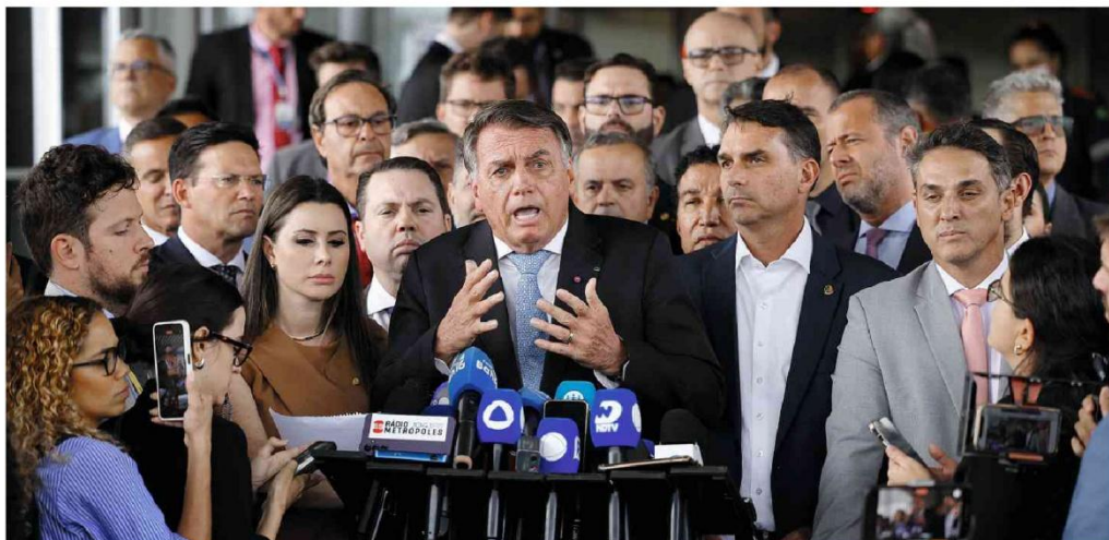
Com o filho Flávio à sua esquerda e cercado de aliados, Jair Bolsonaro discursa diante do Senado após virar réu em processo no STF por trama golpista de 2022.