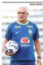
CBF CONVOCAR DORNAL JÚNIOR PARA REUNIÃO SEXTA-FEIRA

Após dez processos de rito ordinário sobre sua definição no âmbito jurídico, o governo aguarda a avaliação da PGE sobre decisão do STF que estabeleceu a Lei do Piso. O Sistema vê mais obstáculos para o pagamento das retroativas. • PÁGINA 12 •