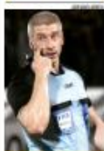
DARONCO É O ESCOLHIDO PARA APITAR A DECISÃO