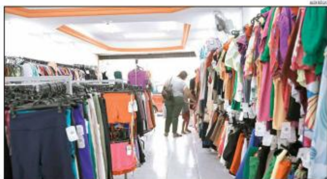
Até 10 de março deste ano, o RN somava 269.831 pequenos negócios ativos, ou seja, um crescimento de 5.340 empresas só em 2025