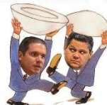
— Fim de semana, vamos botar Câmara e Senado para descansar...