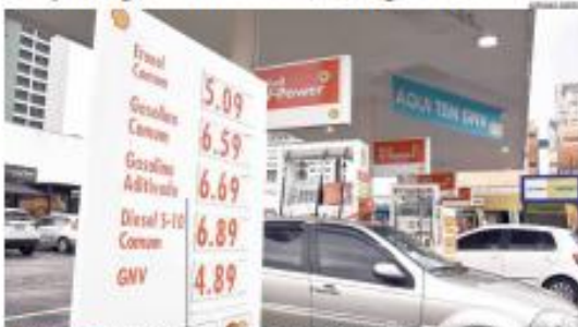
«COMÉRCIO» De acordo com pesquisa realizada pelo Procon Natal, nas primeiras semanas deste mês, o preço médio da gasolina comum nos postos caiu de R$ 6,76 para R$ 6,60. «PÁGINA 6»