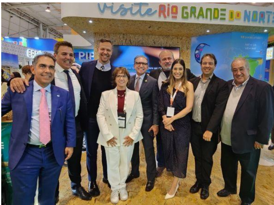
Fecomércio RN participa da Bolsa de Turismo de Lisboa

BTL 2025: Fecomércio RN busca apoio da Embratur para promoção internacional do Turismo de Sol e Mar