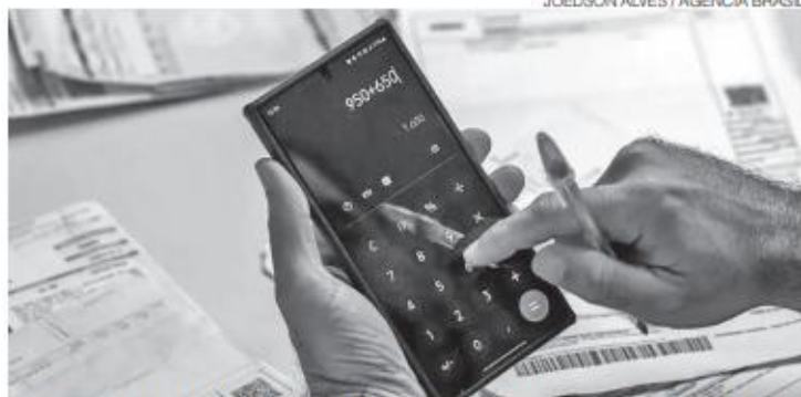
Ação ocorrerá no Partage Norte Shopping e na Uninassau – Roberto Freire