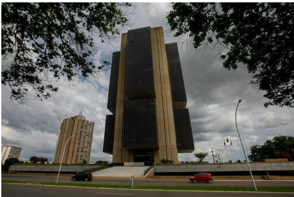
O prédio do Banco Central, em Brasília