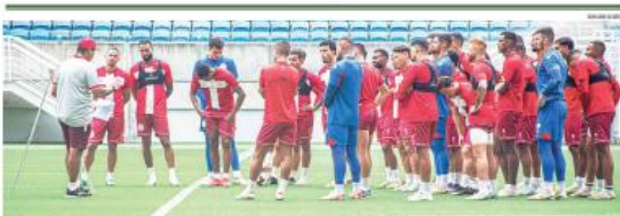
«CAMPEONATO ESTADUAL» O América entra em campo, sábado (16), para enfrentar o Santa Cruz, precisando vencer por dois gols de diferença para garantir a vaga na final e evitar uma "tragédia" na temporada. A partida, que terá Arbitragem de Vídeo - VAR, será disputada na Casa de Apoio da Arena das Dunas. «PÁGINA 12»