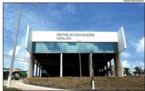
Centro de Convenções terá estudos para ampliação, modernização e melhoria da infraestrutura

Recentemente, interlocutores do setor produtivo sugeriram