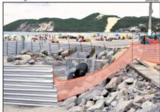
«OBRA» Sistema de drenagem no aterro de Ponta Negra já está em operação e tem 16 dispositivos de energia para controlar a vazão da água das chuvas. Na estrutura, falta apenas o acabamento. «PÁGINA 3»