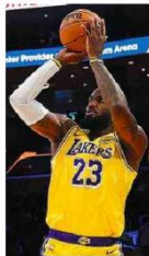
Ídolo do Lakers atinge marca na NBA aos 40 anos

LEBRON JAMES É 1º A FAZER 50 MIL PONTOS A30