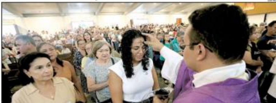
«CELEBRAÇÃO» A Quarta-feira de Cinzas, celebrada ontem (5) pela Igreja Católica, marcou o início da Quaresma para os cristãos. O período de 40 dias que antecede a Páscoa é um convite à conversão e à reflexão sobre a vida espiritual. Durante as missas, os fiéis participaram do tradicional rito da imposição das cinzas. «PÁGINA 3»