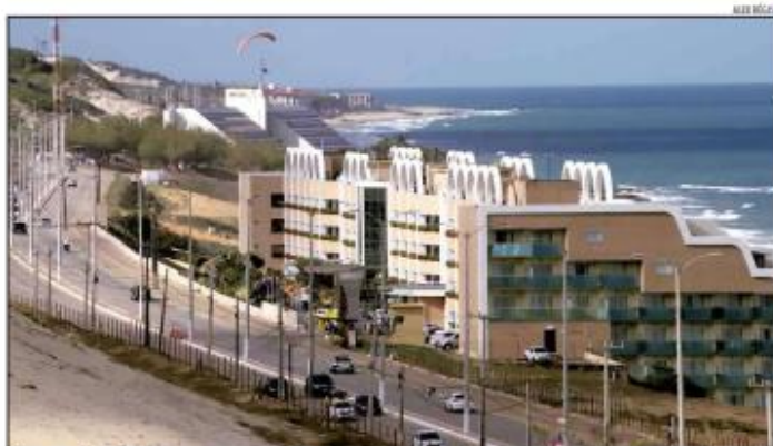
Para empresários do setor, o aumento reflete o fortalecimento da capital potiguar como destino turístico no período do carnaval