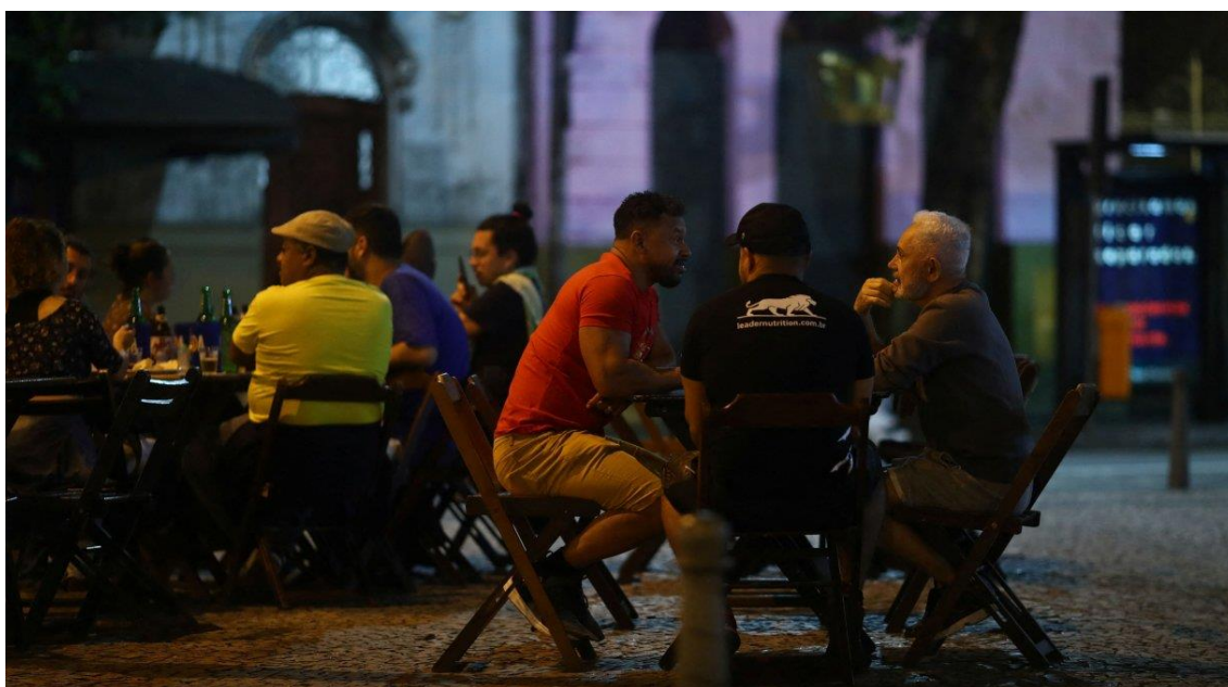
Clientes conversam em bar no Rio de Janeiro, Brasil • 13/05/2021

A atividade de serviços do Brasil voltou a crescer em fevereiro após uma retração em janeiro, em recuperação impulsionada por um aumento moderado da demanda dos clientes que se deu em meio a reajustes de preços finais, mostrou a pesquisa Índice de Gerentes de Compras (PMI, na sigla em inglês).