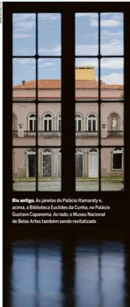
Rio antigo. As janelas do Palácio Itamaraty e, acima, a Biblioteca Euclides da Cunha, no Palácio Gustavo Capanema. Ao lado, o Museu Nacional de Belas Artes também sendo revitalizado

Quatro ícones históricos do Rio, o Palácio Gustavo Capanema, a Estação Barão de Mauá, o Museu Nacional de Belas Artes e o complexo do Itamaraty estão sendo restaurados e serão devolvidos à cidade. O primeiro a ser reaberto será o Capanema, fechado há mais de dez anos e quase leilado no governo Bolsonaro. O edifício sediará a reunião do Brics, em julho. PÁGINAS 14 e 15