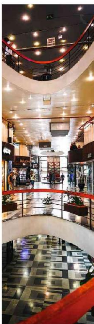
Galeria do Rock, no centro de São Paulo, inaugurada em 1963

O cérebro vencido busca recuperar o controle de alguma coisa A34