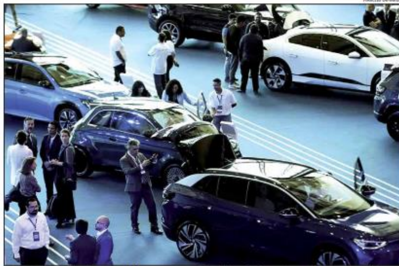
Um dos fatores que influenciam as vendas é o aumento de condições mais favoráveis, como descontos e taxas mais reduzidas

Por outro lado, a economia do estado tem características distintas, com menor participação da indústria e maior dependência do turismo e da fruticultura. "Diferentemente de outros estados, onde o agronegócio tem papel central, nossa economia depende muito do turismo, que não impacta o mercado automotivo de maneira tão direta e imediata. Pode ser que a circulação de dinheiro gerado na alta tempo-