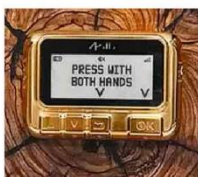
Pager que Netanyahu deu a Trump evoca ataque

Parte do acervo da Objeto de Cena, aberta há 25 anos em São Paulo; peças são alugadas e vendidas e já foram vistas, por exemplo, em produções sobre Hebe e Senna Mercado A17