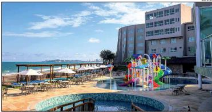
Ranking Decolar inseriu Natal entre as 10 cidades mais buscadas para o Carnaval neste ano; Abav espera crescimento de até 20%