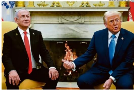
O aliado. Netanyahu foi o primeiro chefe de governo a ser recebido por Trump na Casa Branca neste segundo mandato

planos e ignorando legislações internacionais, Trump não descartou o uso de força militar para o objetivo. O presidente americano tem adotado uma retórica agressiva e de choque desde que voltou ao poder, e as falas da noite de ontem trazem incerteza sobre o futuro imediato do conflito, cujo recente acordo de cessar-fogo está apenas na primeira fase. PÁGINA 16