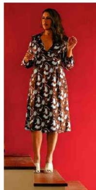
Karla Sofia Gascón, indicada ao Oscar, envolveu-se em polêmica por postagens antigas