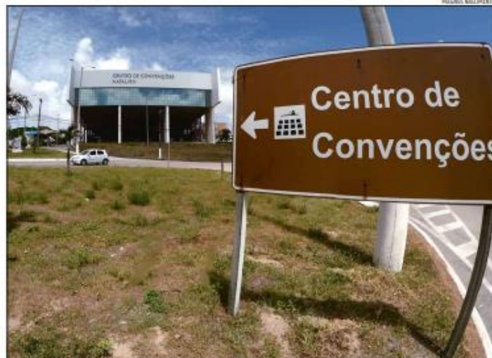
O Centro de Convenções de Natal terá estudos voltados para ampliação, modernização e melhoria de sua infraestrutura

“Não tratamos dos outros porque nunca fizemos isso antes. Se você lançar 200 equipamentos, terminaria tendo 1 parceria. Centralizamos nesses e, depois que for feita a licitação, aí temos como colocar os demais. As propostas do Sindicato e Business foram exceções, mas não queremos misturar para não dar complicações”, acrescenta.