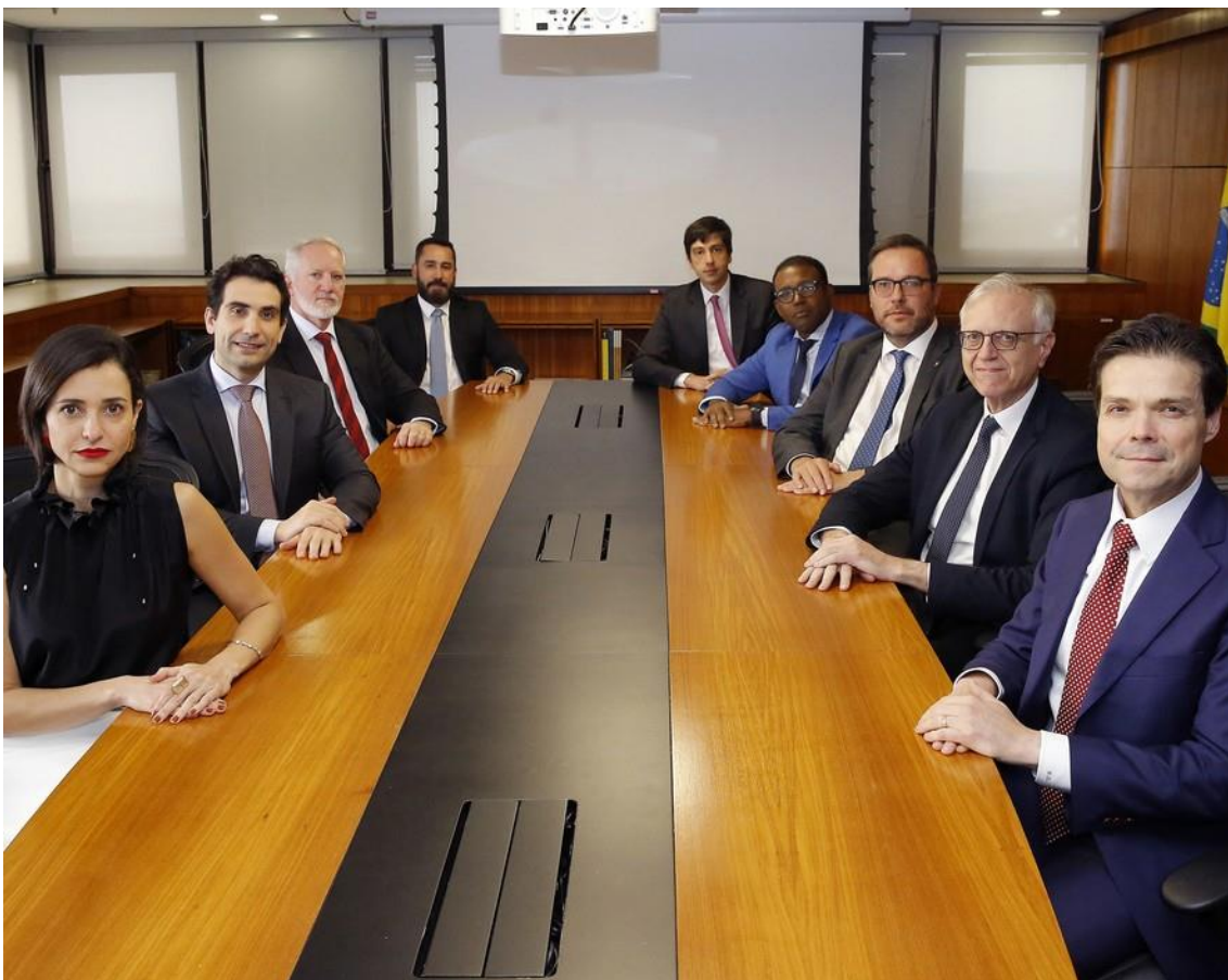
Membros do Comitê de Política Monetária (Copom) do Banco Central (BC)

Segundo ata do colegiado, os dados ainda são de alta frequência, e as dificuldades com sazonalidade e revisões frequentes em tais séries demandam maior cautela na análise