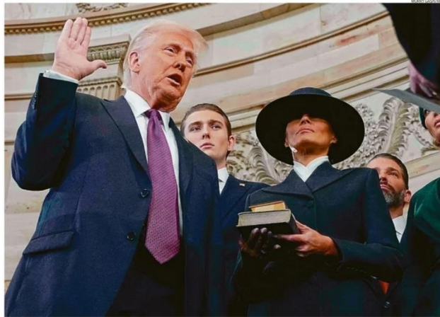
Empossado. Donald Trump faz juramento ao lado da primeira-dama Melania e se torna o segundo presidente da História dos EUA a ser eleito após perder reeleição

'Brasil precisa mais de nós', diz presidente, que ameaça taxar Brics em 100%