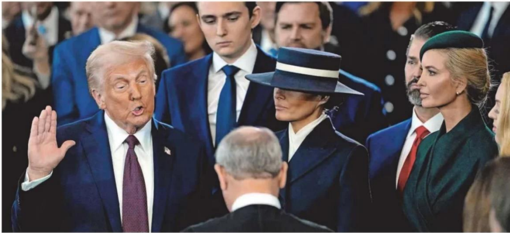
Donald Trump faz juramento ao lado da mulher, Melania, e dos filhos Barron, Trump Jr. e Ivanka, ao tomar posse no Capitólio, em Washington