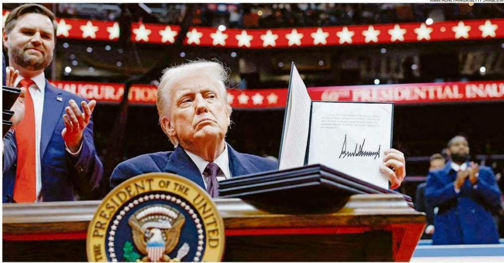
Trump exibe um dos decretos assinados por ele após tomar posse como 47º presidente dos EUA; cerca de 80 políticas implantadas pelo governo Joe Biden foram revogadas

Guinada nos EUA prevê barreira à imigração e controle do Canal do Panamá