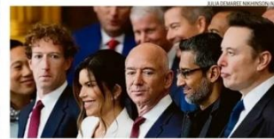
Convidados de honra. Mark Zuckerberg, da Meta; Jeff Bezos e a mulher Lauren Sanchez, da Amazon; Sundar Pichai, do Google; e Elon Musk, do X e da Tesla, tiveram lugar de destaque na cerimônia no Congresso

Donald Trump tomou posse para seu novo mandato prometendo resgatar a "idade de ouro" dos Estados Unidos e imediatamente assinou uma série de decretos com impactos globais, que vão do endurecimento das políticas de migração à saída da Organização Mundial da Saúde (OMS) e do Acordo de Paris, o pacto internacional pela redução das emissões de gases do efeito estufa. Com atos executivos, o novo presidente designou cartéis mexicanos como organizações terroristas e declarou emergência nacional na fronteira com o México, para promover o seu plano de deportação em massa. Em entrevista, disse que "o Brasil e a América Latina precisam muito mais dos EUA do que nós deles" e ameaçou taxar em 100% produtos do Brics. Quatro anos após os ataques ao Capitólio, ele concedeu perdão a 1.500 condenados pela invasão e, prometendo acabar com medidas de "engenharia social", encerrou todos os programas de diversidade no governo e determinou a existência legal de apenas dois gêneros no país. PÁGINAS 15 e 18