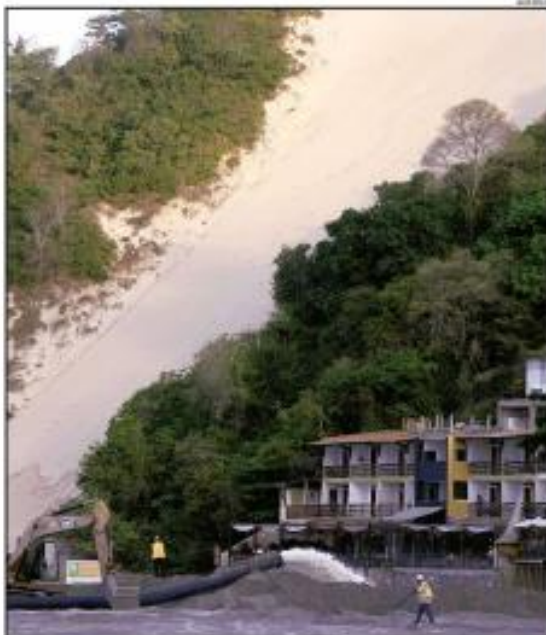
« TRABALHO » À esquerda da Praia de Ponta Negra está na sua reta final. Com mais de 95% do projeto concluído, a expectativa é que até o final da semana a faixa de areia esteja completa. Então, as máquinas estavam a alguns metros do Meiro da Carne, que será protegido com a obra. « PÁGINA 6 »

« DESENVOLVIMENTO » A Prefeitura de Natal está analisando a possibilidade de realizar uma Parceria Público-Privada na área do entorno da praia de Ponta Negra. O objetivo é garantir a organização da orla, com segurança e manutenção, além de permitir a exploração comercial no calçadão da praia. « PÁGINA 6 »