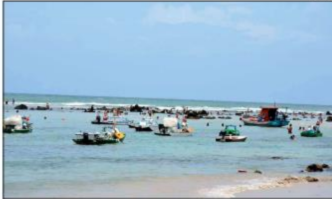
O movimento "Preserve Pipa", liderado por hotéis e pousadas, adota práticas que privilegiam a sustentabilidade

«VERÃO» Dona de boa infraestrutura e atrativos naturais únicos, Pipa se consolida como polo turístico no Rio Grande do Norte. Destino combina charme rústico com sofisticação, mas precisa de mais investimentos