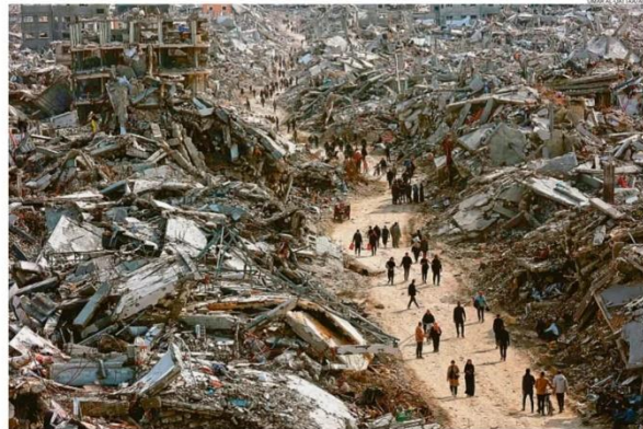
Devastação. Palestinos deslocados pela guerra retornam ao campo de Jabalya, no norte da Faixa de Gaza, logo após implementação do cessar-fogo