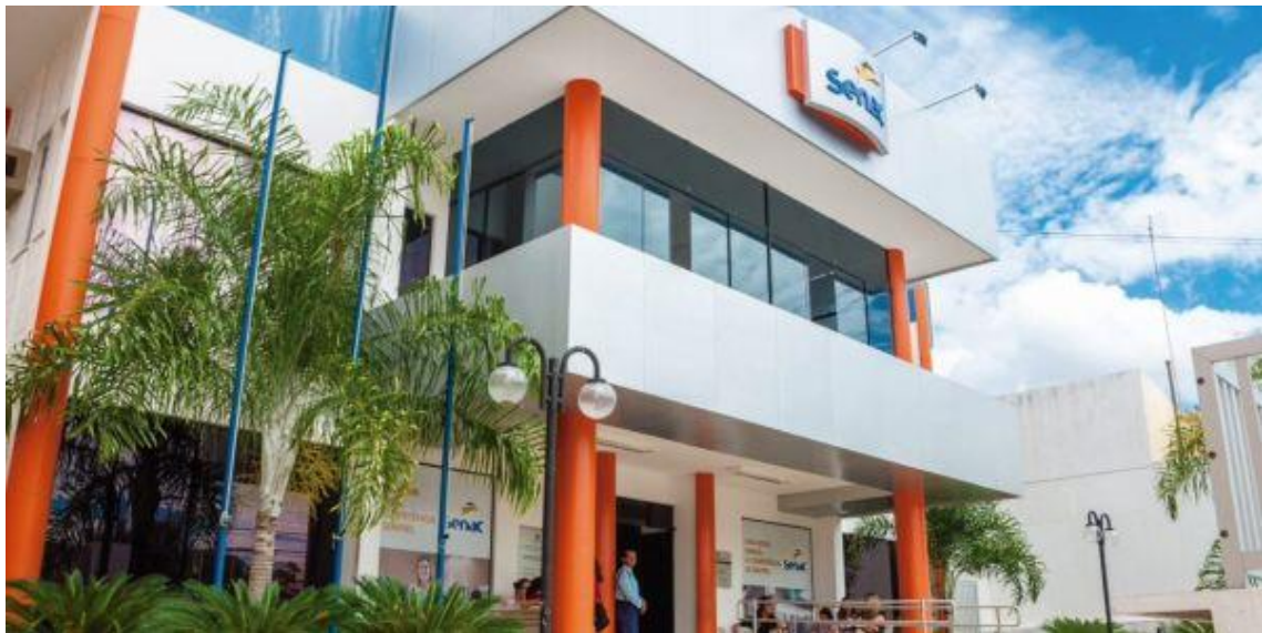
Senac Alecrim – Natal

O Senac RN está abrindo vagas para composição da equipe técnica do novo ciclo do Programa de Qualificação para Exportação (PEIEX) no Rio Grande do Norte. As oportunidades são para a função de coordenador geral e equipe técnica, que irão atuar no Núcleo Operacional do PEIEX em Natal, Guamaré, Mossoró e Caicó.