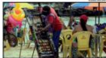
» NEGÓCIO O verão tem aquecido não apenas o clima no RN, mas também tem contribuído para o surgimento de novas oportunidades aos empreendedores. » PÁGINA 19

O secretário estadual de Agricultura, Pecuária, Pesca, Guilherme Sablanha, acredita que durante o ano de 2025 o Brasil conseguirá superar o embargo das países europeias ao camarão produzido no estado. Também trabalha para a exportação recente. » PÁGINA 19