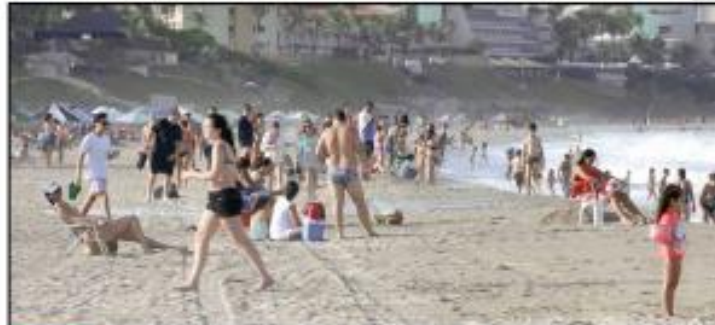
» DELÍRIO A esplanada de Ponta Negra trouxe uma nova realidade para o principal cartão-postal de Natal. O impacto do projeto de ampliação pode ser sentido na rotina dos frequentadores, seja para um passeio, prática esportiva ou lazer em família. » PÁGINA 16

Diversos processos infecciosos causados por vírus – as doenças virais – ocorrem no verão em ambiente propício para se manifestarem com mais força. Cuidado com os sintomas e procure ajuda médica adequada. » PÁGINA 19