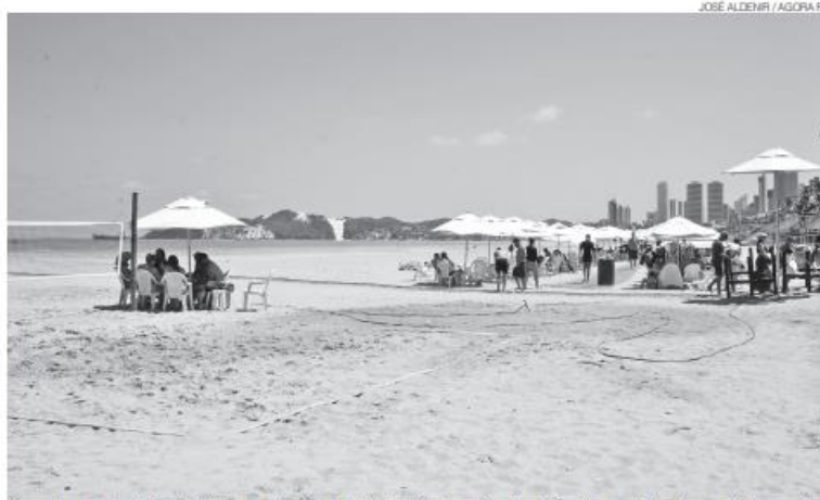
Obra da engorda de Ponta Negra, que deve ser finalizada ainda em janeiro, irá conter os efeitos da maré alta na orla