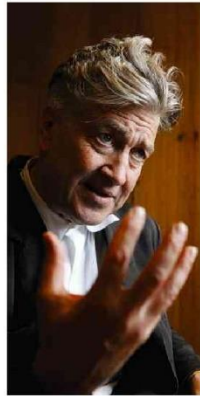
O diretor em entrevista ao visitar o Brasil, em 2008

Blue Origin lança foguete à órbita, mas falha no pouso A34