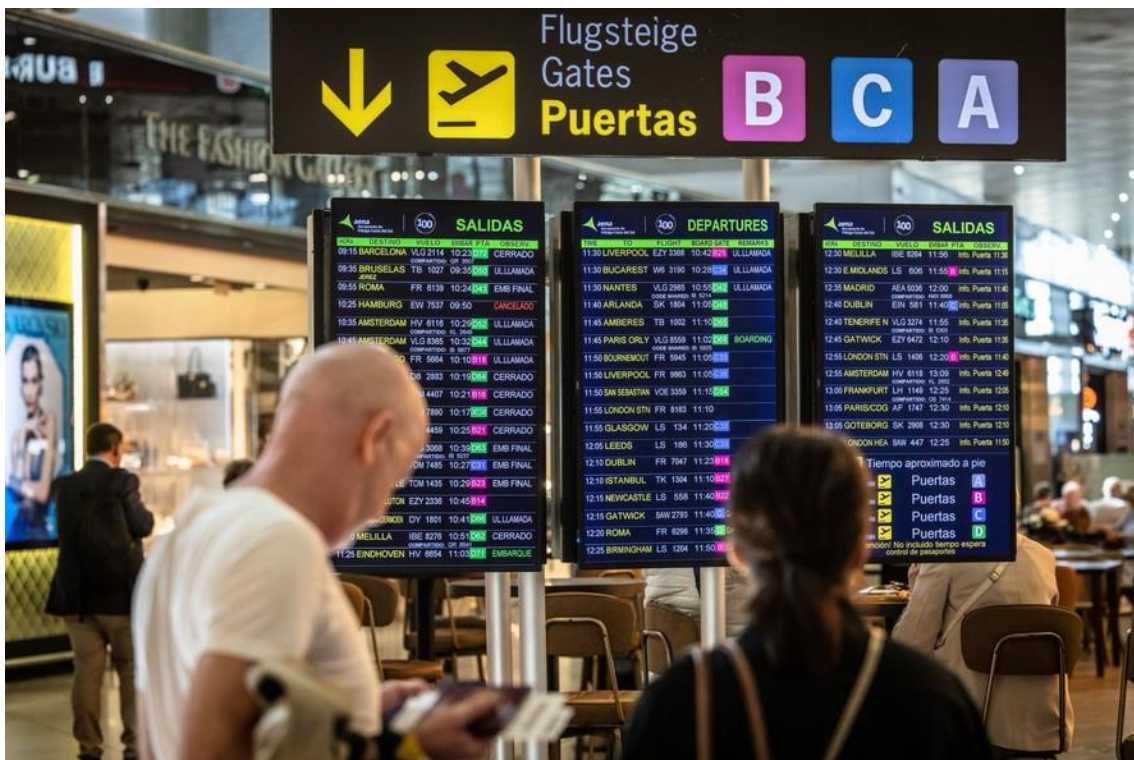
Passageiros observam painel com voos no aeroporto de Málaga, na Espanha: preços de passagens aéreas estão nas alturas

Silvio Costa Filho ressaltou a importância de comprar passagens com antecedência para conseguir valores mais em conta