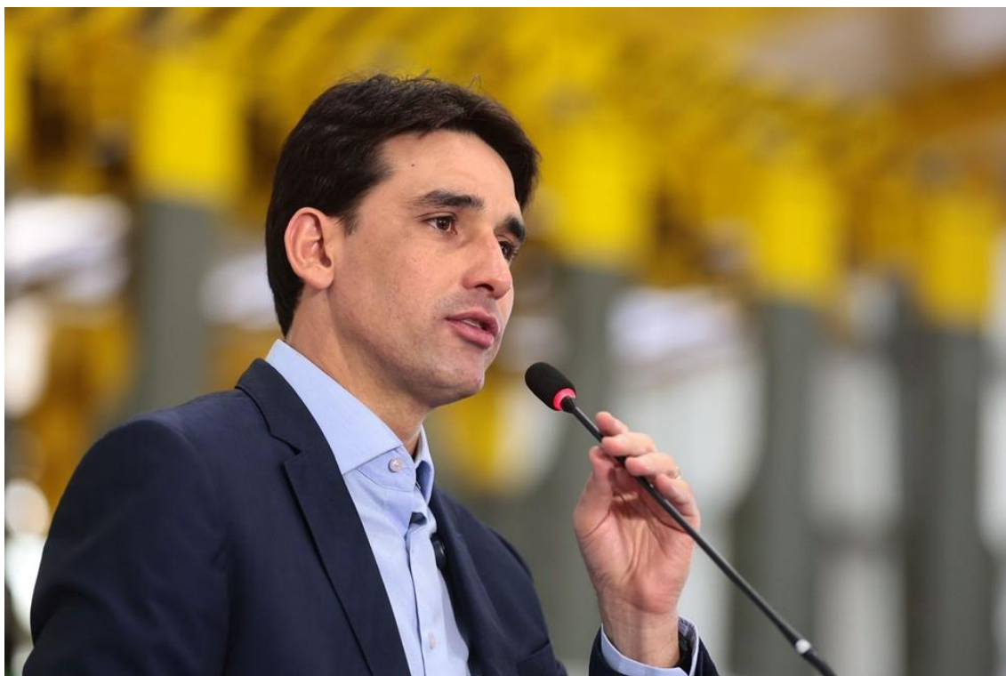
Ministro dos Portos e Aeroportos, Silvio Costa Filho.

Segundo dados da Agência Nacional de Aviação Civil (Anac), o valor médio no ano passado foi de R$ 632,16. De acordo com o ministro, metade dos passageiros pagou menos de R$ 500.