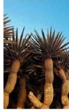
Árvore do dragão, em Socotra

Ilha no Iêmen abriga cenários de ficção científica B9