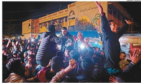
Celebração imediata. A notícia do acordo pelo cessar-fogo foi festejada nas ruas de Khan Yunis, principal cidade do sul da Faixa de Gaza. Em Israel, também houve comemoração entre os parentes de reféns que há 15 meses pressionam Netanyahu

Mediados por EUA, Egito e Catar, Hamas e Israel selam cessar-fogo e libertação de reféns e presos, com saída das tropas de Gaza